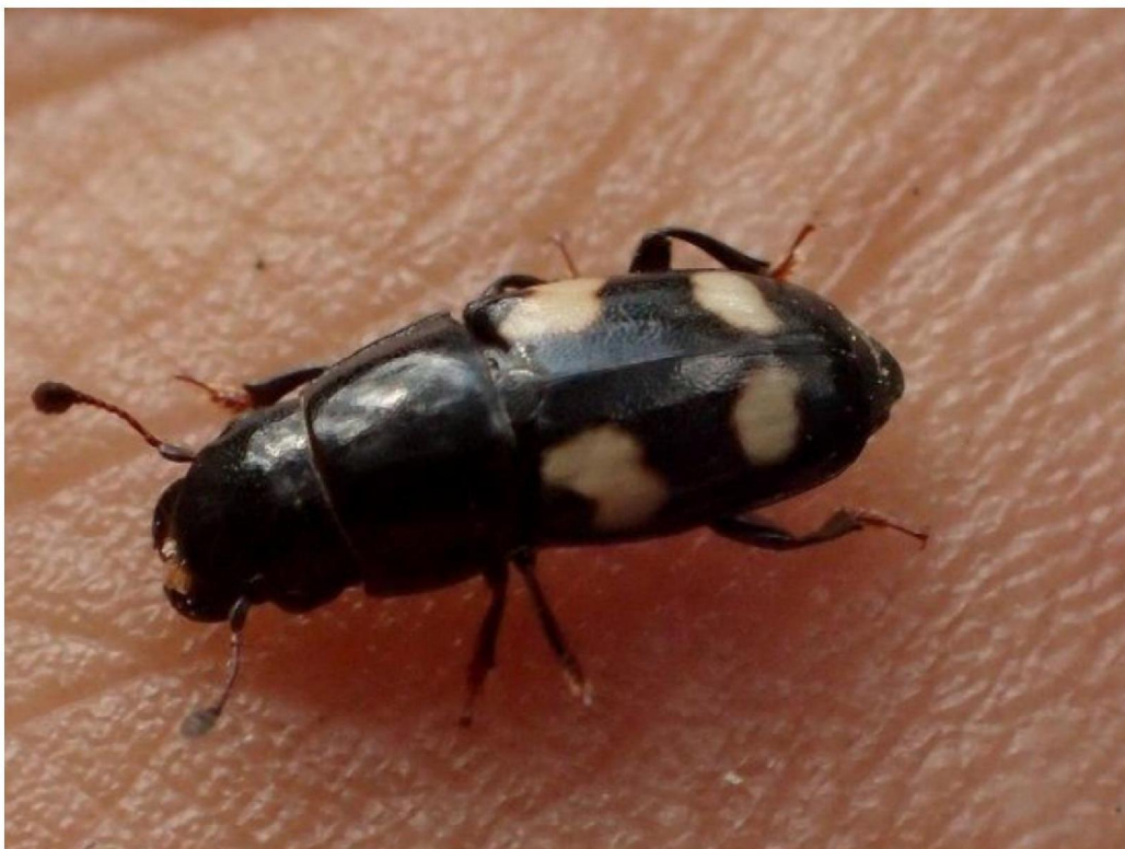
20190716_2 Glischrochilus quadrisignatus (Nitidulidae) in het noorden van het Meddosche Veen