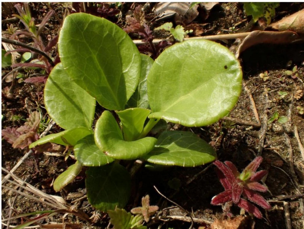
#20190613 Rond Wintergroen in afgegraven terrein