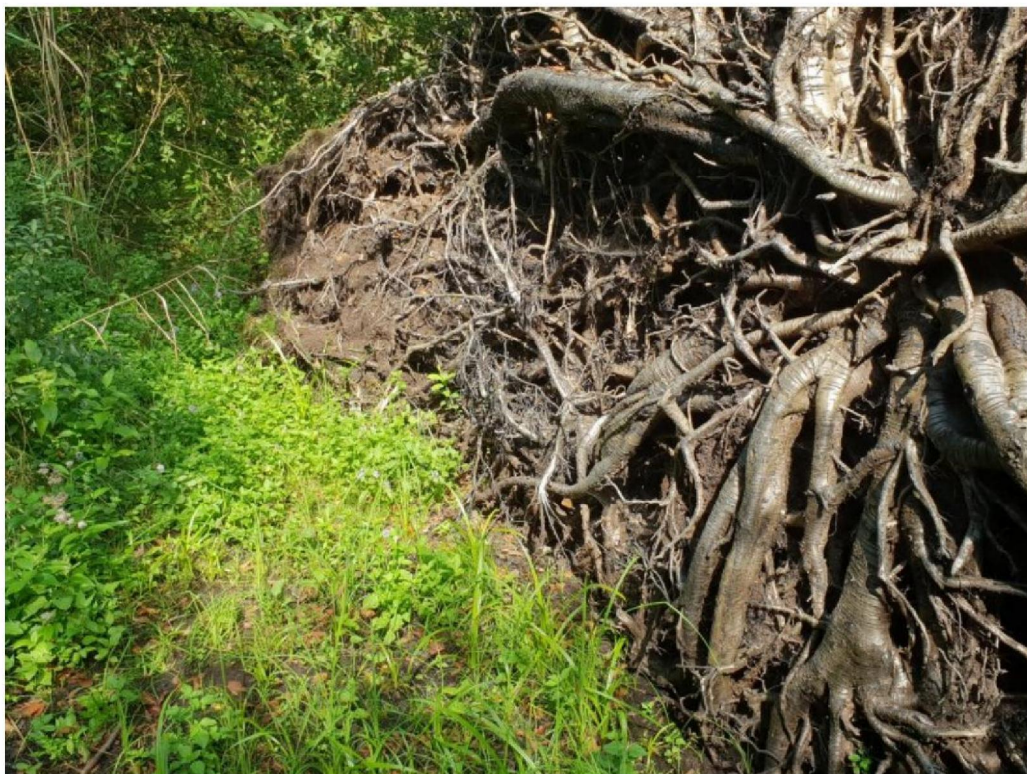
#20190910_2 Massale kieming van Hoge Cyperzegge onder omgewaaide Zwarte Els in het Corlesche Veen