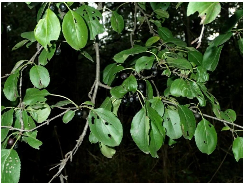
#20190930 Wededoom in vrucht in het Corlesche Veen bij de Schaarsbeek