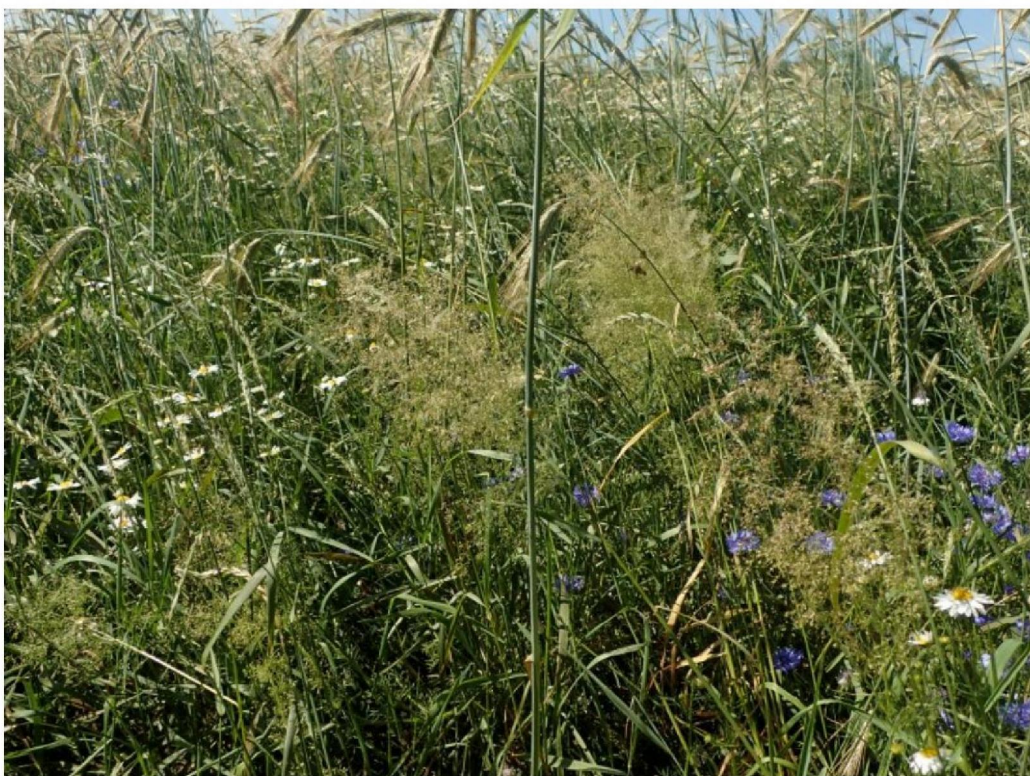
#20190627 Grote Windhalm in graanakker bij Heeminck