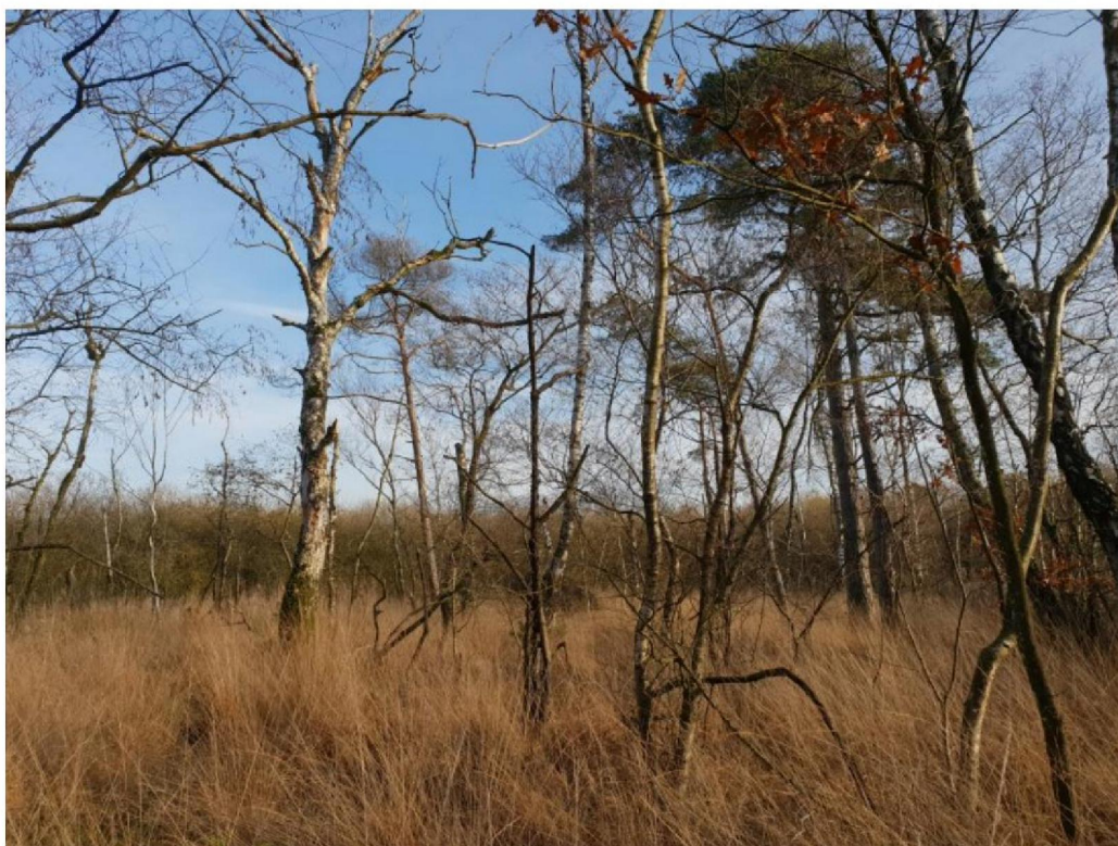
#20191122_2 een erg moeilijk te bereiken hoger deel in de wilgenbroekbossen in het noorden van het Vragenderveen bij de spoorbaan. Bosbesheide, Veenpluis, Eenarig Wollegras en Pijpenstrootje