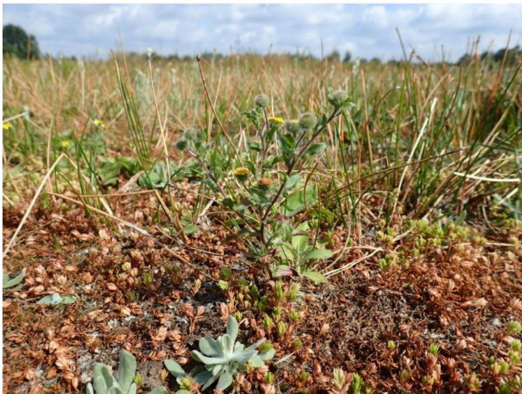
#20190808 Klein Vlooienkruid, Bleekgele Droogbloem en Watercrassula in afgegraven terrein