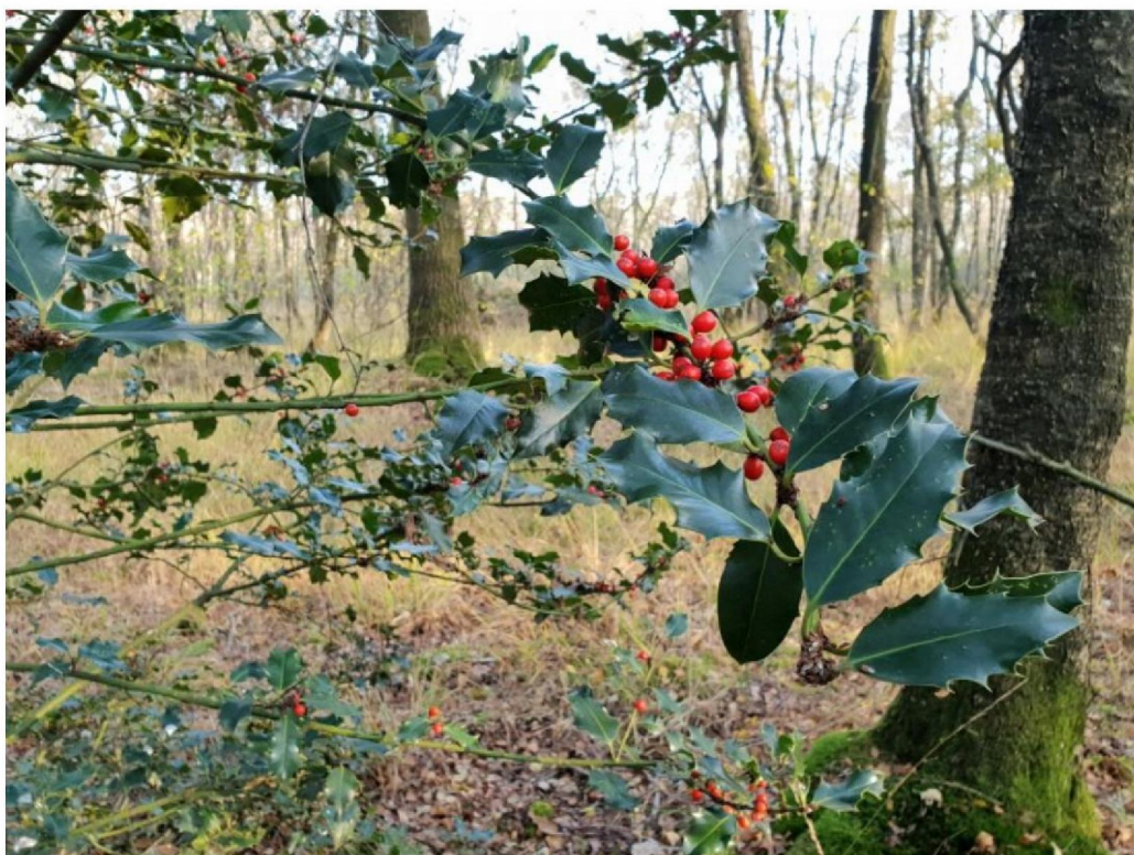
#20191030 Hulst in het noorden van het Meddosche Veen