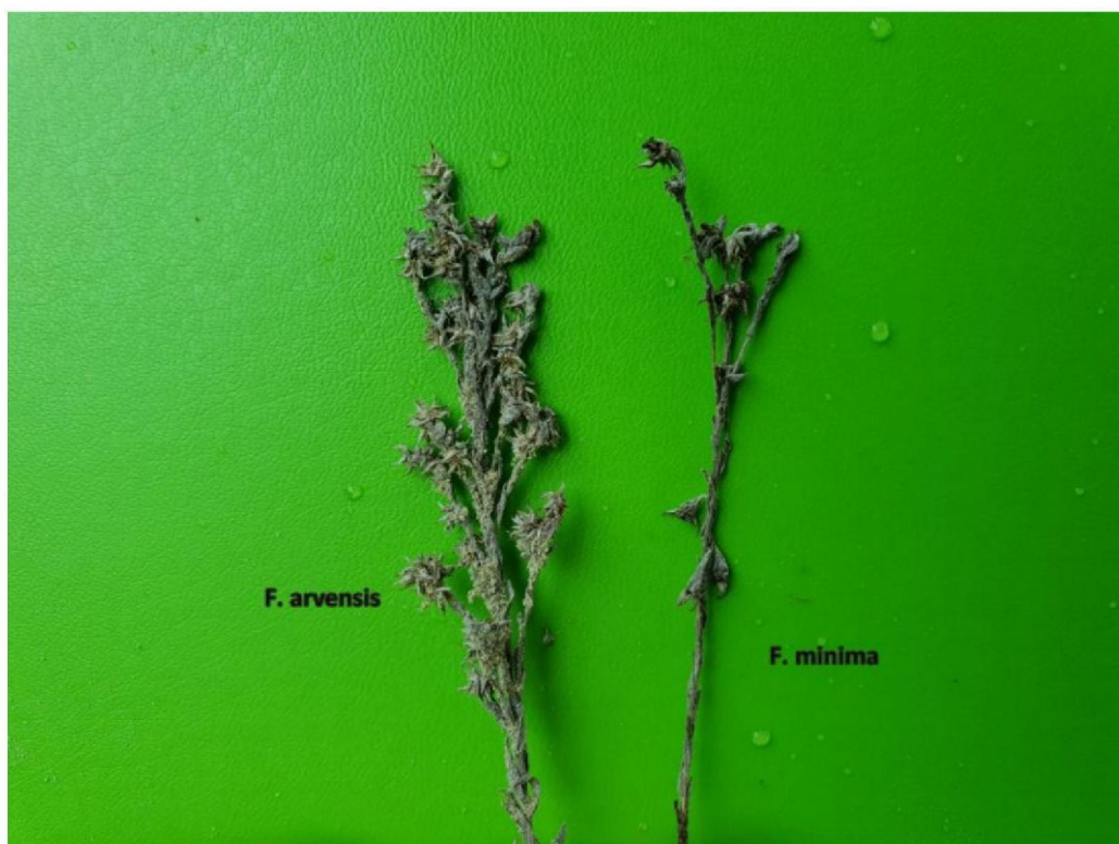
#20190905 Akkerviltkruid en Dwergviltkruid, gevonden in afgegraven terrein