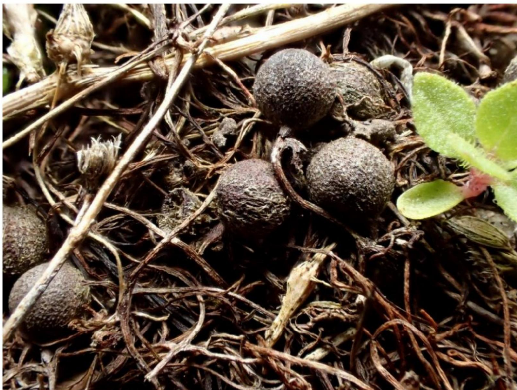
#20190905_2 De sporen van Pilvaren in afgegraven terrein in het Meddosche Veen.