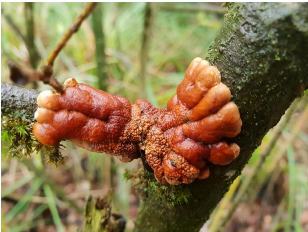
#20191106 De zeer zeldzame Rozetkussentjeszwam ( Hypocreopsis lichenoides ) in wilgenstruweel ten zuiden van de Pollendijk