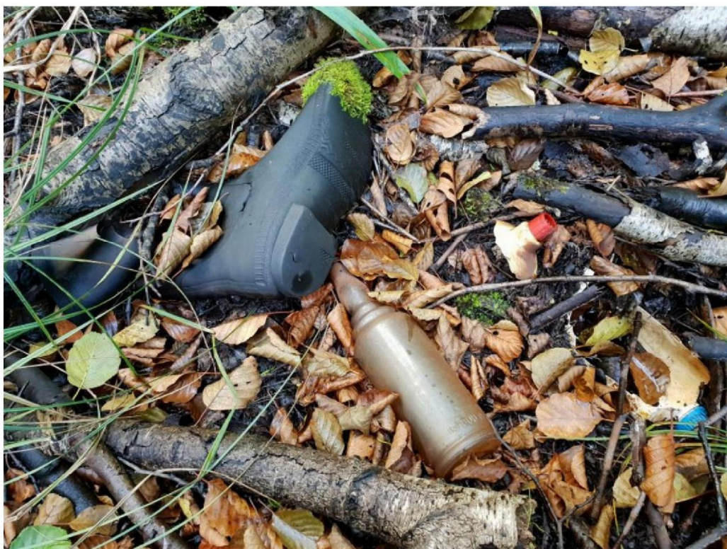
#20190918 Kleine vuilstort uit het midden van de 20 ste eeuw in het Corlesche Veen bij Manenschijn