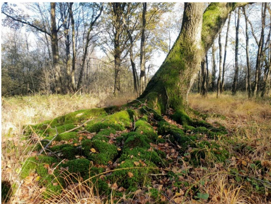
#20191108_1 Zomereik en Pijpenstrootje op hoger deel in moerasbos ten zuiden van de Pollendijk