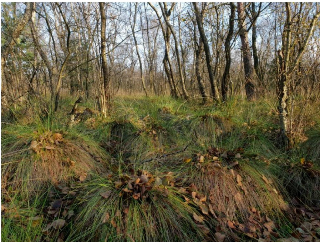
#20191029 Eenarig Wollegras in berkenbroek in het Meddosche Veen