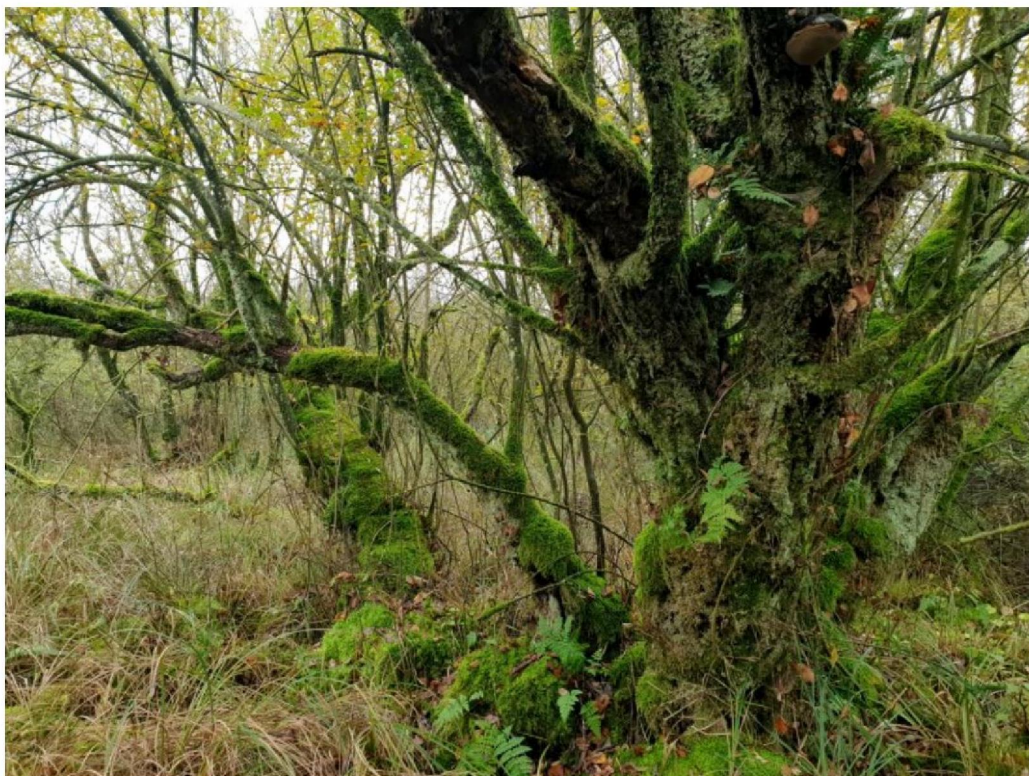
#20191105_1 Gewone Eikvaren op een heel dikke Grauwe Wilg ten oosten van de Nijenhuisdijk