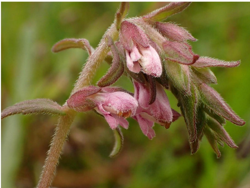
#20190716 Rode Ogentroost in grasland ten zuiden van de Schaarsbeek in de bufferzone