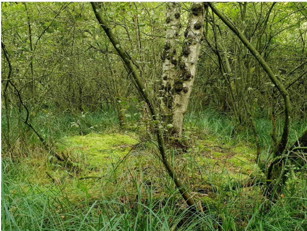
#20190910 Corlesche Veen: Zachte Berk en veenmos in hoger deel in wilgenbroekbos met Stijve Zegge .