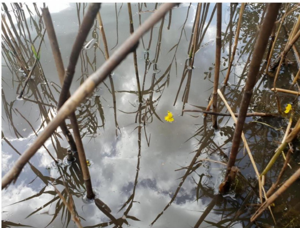
#20190613 Loos Blaasjeskruid in de Eendenput