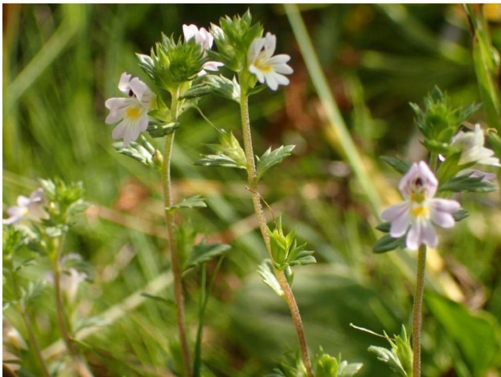
#20190821 Bosogentroost langs de Middeldijk