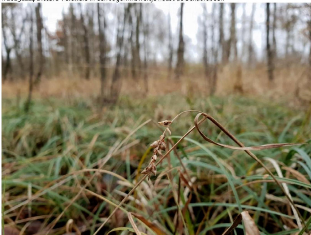
#20191115 Blauwe Zegge in berkenbroekbos in het zuiden van het Corlesche Veen