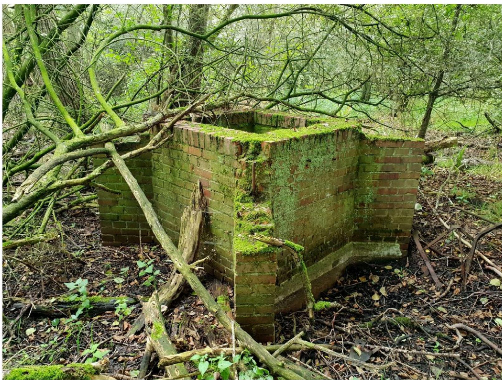
#20190918 Bouwwerk bij een sloot in het Corlesche Veen bij Manenschijn