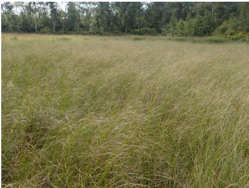
#20190821_2 Draadzegge in het westelijk deel van de schraallanden bij den Oppas