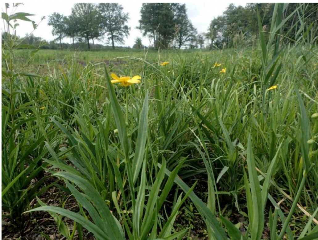
#20190621_2 Grote Boterbloem op afgeplagd broekbos bij den Oppas