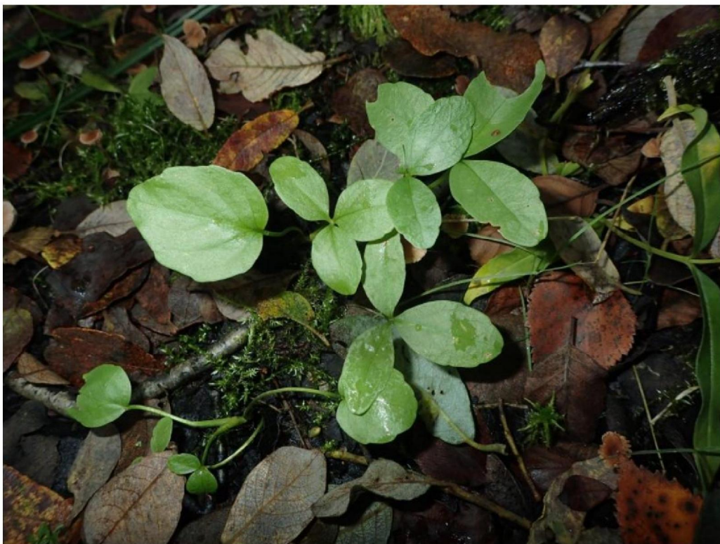
#20190927 Zaailingen van Waterdrieblad in moerasbos ten zuiden van de Pollendijk