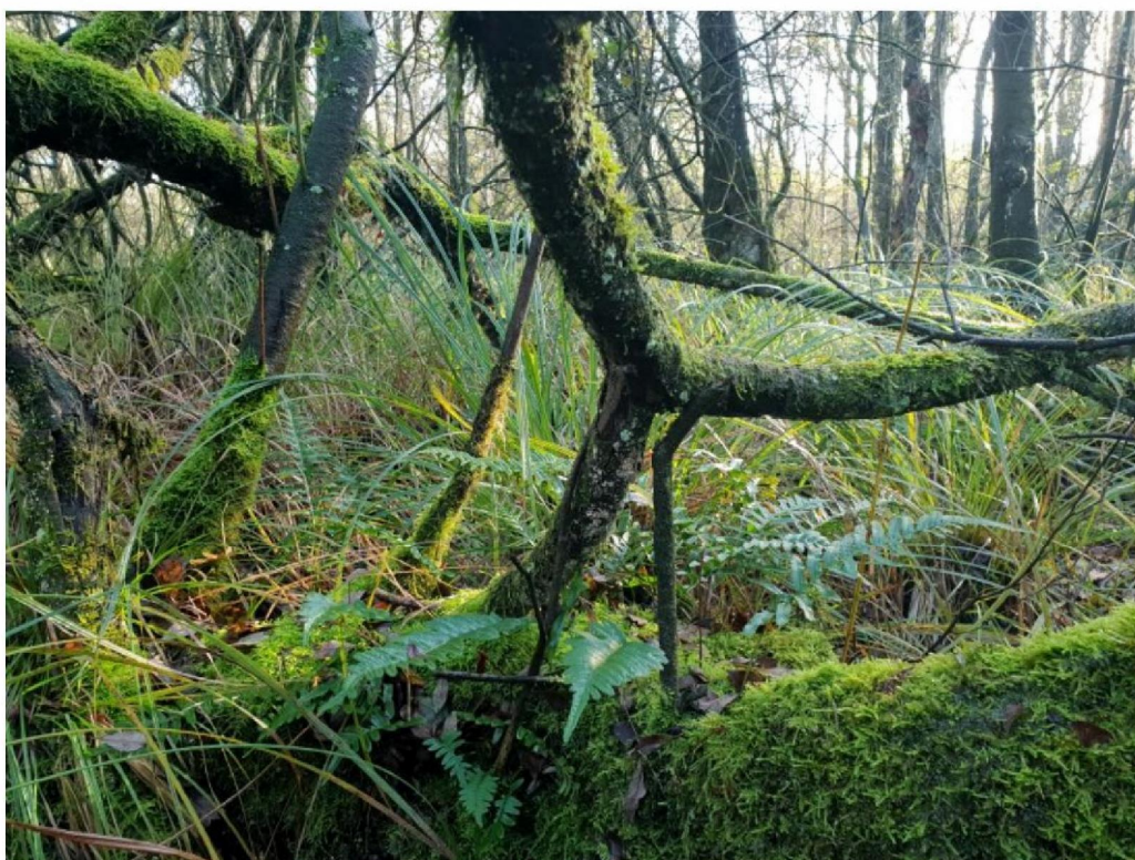
#20191108_2 Eikvaren en Stijve Zegge in wilgenstruweel bij de Pollendijk