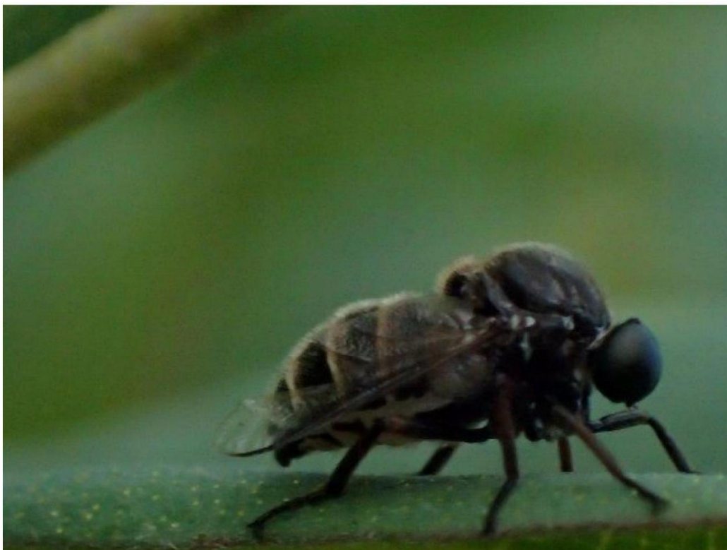
#20191621_3 Een spinvlieg ( Ogcodes zonatus , Acroceridae) in moerassig schraalland bij den Oppas. Deze vlieg is maar op 3 plekken in NL gevonden volgens waarneming.nl