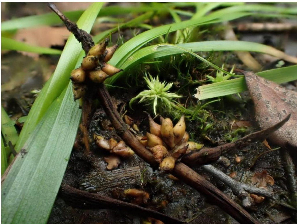
#20190924 Kleinste Egelskop naast de damwand tussen Pollendijk en de Badkuip