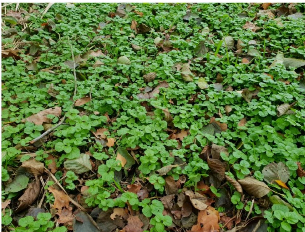
#20191114 Bittere Veldkers in een Jagerinkswitje naast de Schaarsbeek