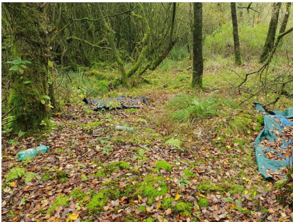
#20191009_4 Oude illegale camperplek ten oosten van de Nijenhuisdijk