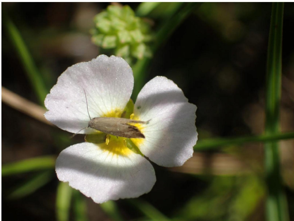
#20190704_1 Stijve Moerasweegbree in moerassig schraalland bij den Oppas