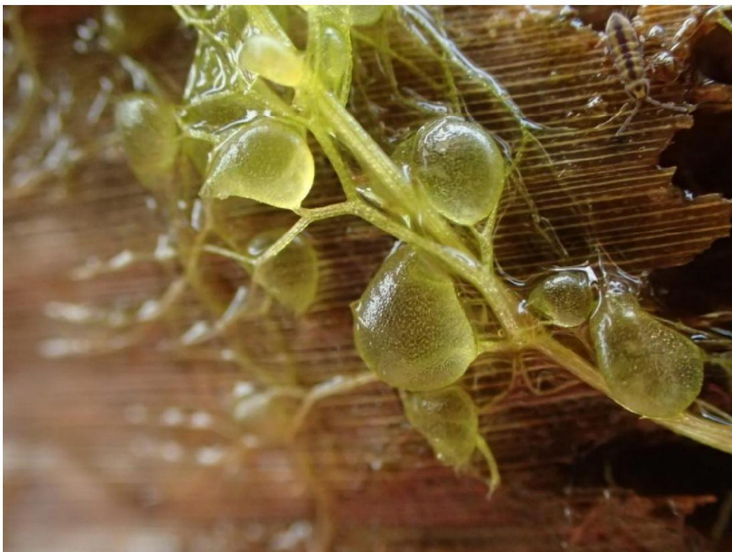
#20190621 Loos Blaasjeskruid op een drooggevalen plek bij de schraallanden