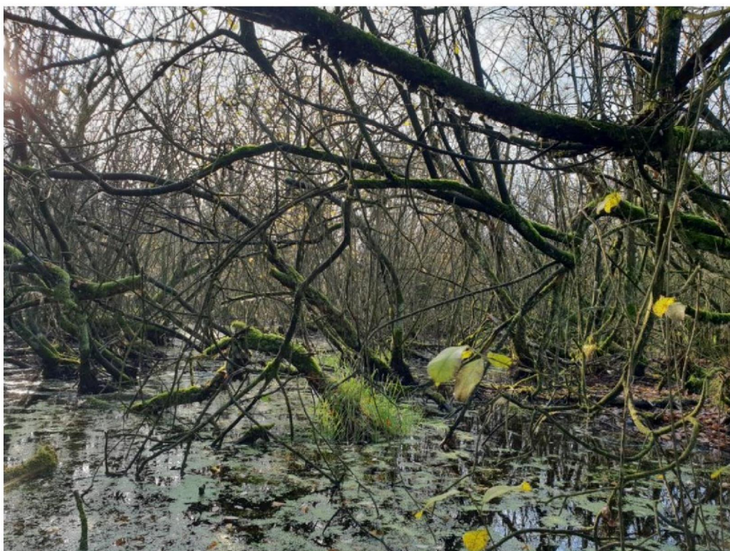
#20191122 Zompzegge met Kleinst Kroos in ondoordringbaar struweel in het noorden van het Vragenderveen