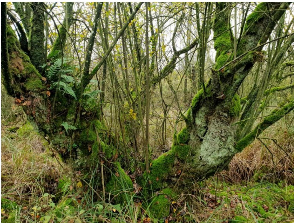
#20191105_2 Gewone Eikvaren op een heel dikke Grauwe Wilg ten oosten van de Nijenhuisdijk (de andere kant)