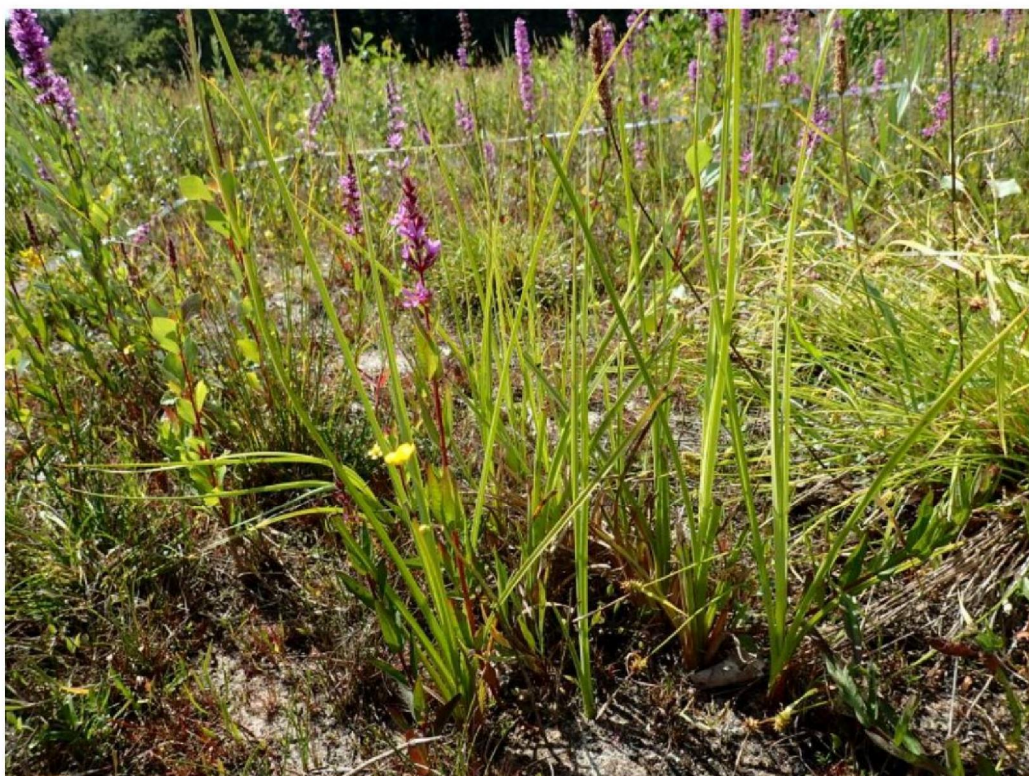
#20190704 zaailing Galigaan in afgegraven terrien ten zuiden van den Oppas