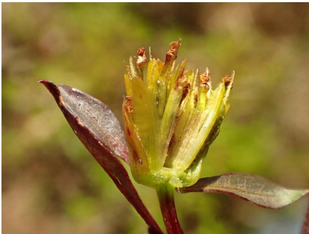
#20190816 Smal Tandzaad in afgegraven terrein bij de schraallanden bij den Oppas