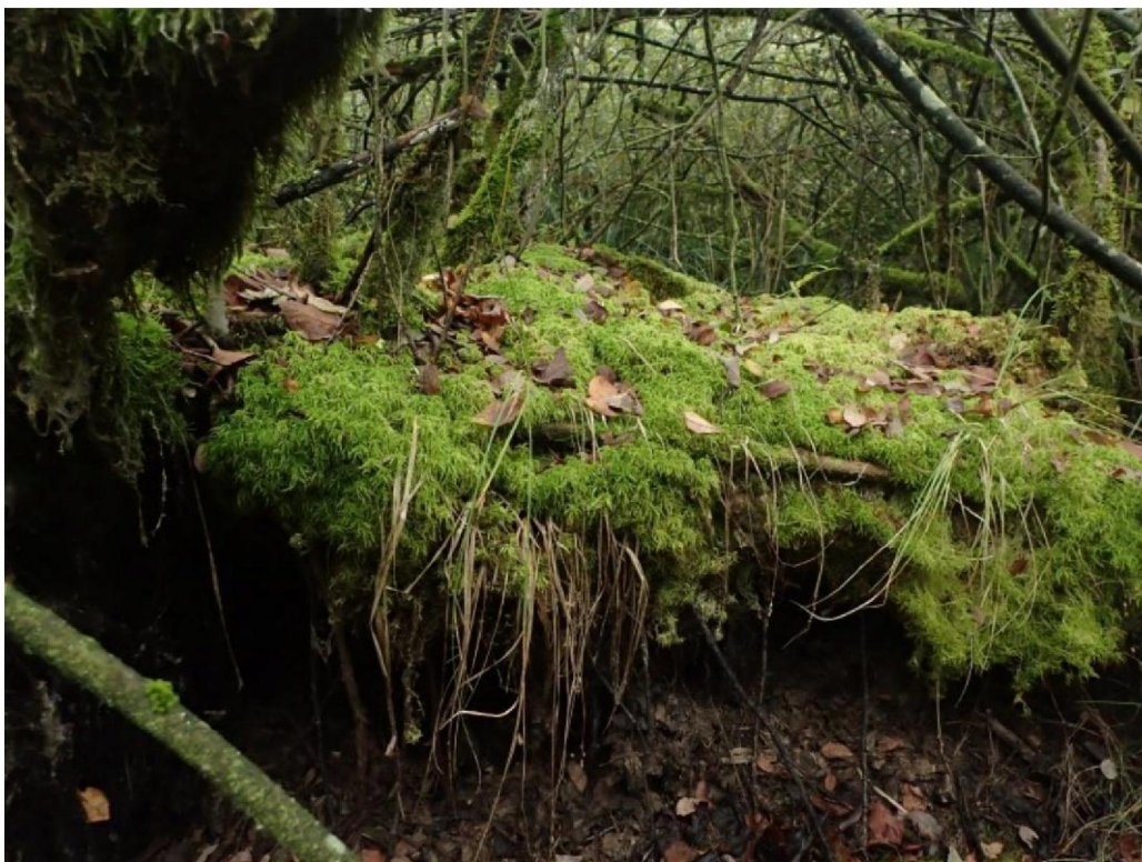
#20190925 Zwevend veenmospakket op horizontale takken in het Meddosche Veen