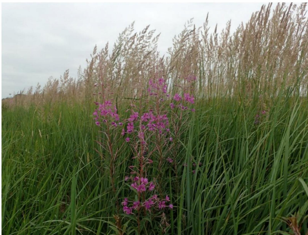
#20190716 Duinriet en Knikkend Wilgenroosje aan de rand van afgegraven terrein bij de spoorbaan