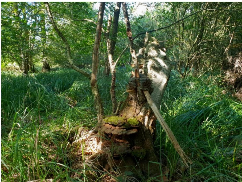
#20190920 Aftakelende Zachte Berk tussen Moeraszegge ten zuiden van de Pollendijk