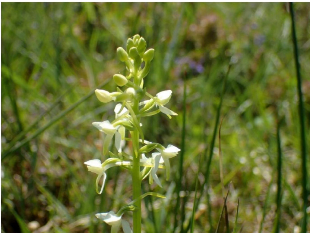
#20190611 Welriekende Nachtorchis in het schraalland achter den Oppas