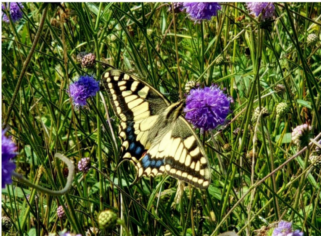
#20190830 Blauwe Knoop en Koniginnepage in de schraallanden bij den Oppas