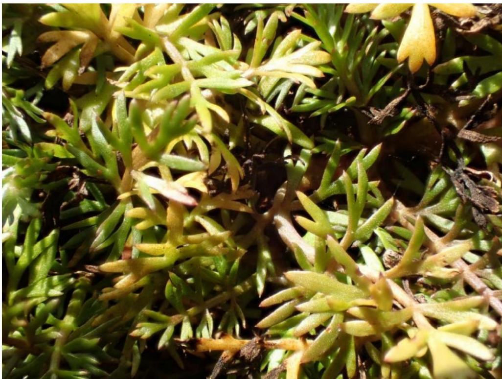
#20190905_3 Ondergedoken Moerasscherm in een drooggevakken poeltje in het Meddosche Veen