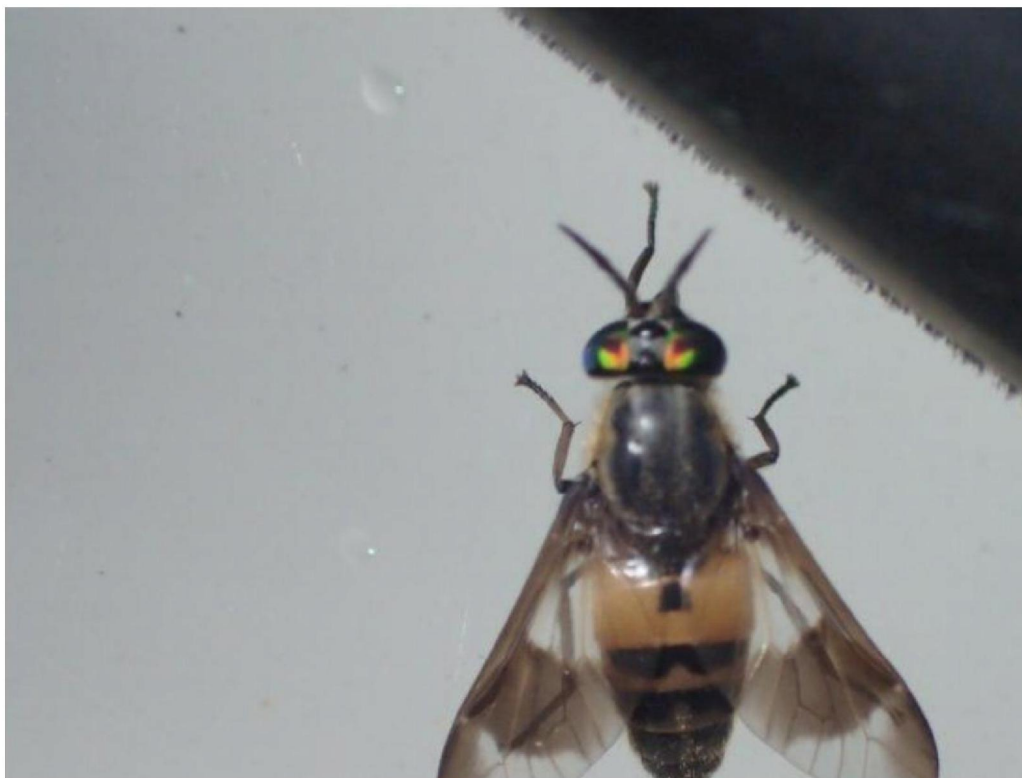
20190716_4 Stipgoudoogdaas ( Chrysops viduatus ; Tabanidae) in de bufferzone bij de Parallelsloot