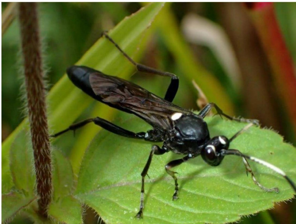
20190716_3 Amblyjoppa proteus (Ichneumonidae) in de bufferzone bij de Parallelsloot