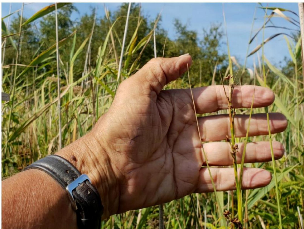
#20190830_2 Bij de Middeldijk, Galigaan, een klein exemplaar in bloei