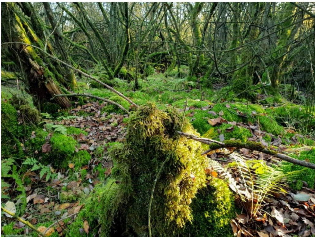
#20191028 Veenmosrijk wilgenstruweel aan de westkant van het Meddosche Veen