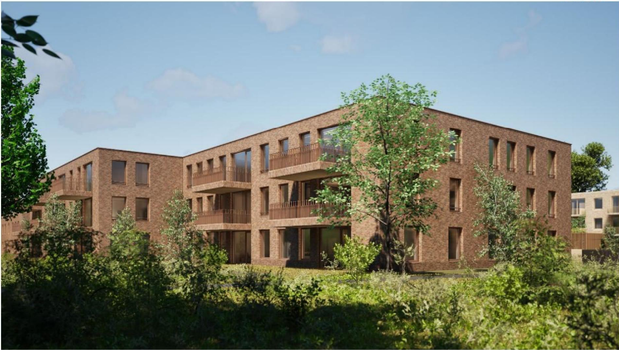
Figuur 4: Bouwdeel B gezien vanuit de noordoosthoek