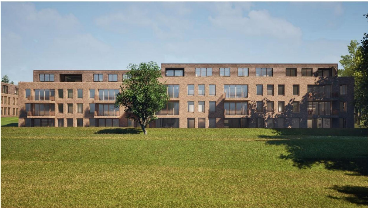
Figuur 3: Aanzicht woningen vanaf de zuidzijde (weiland)