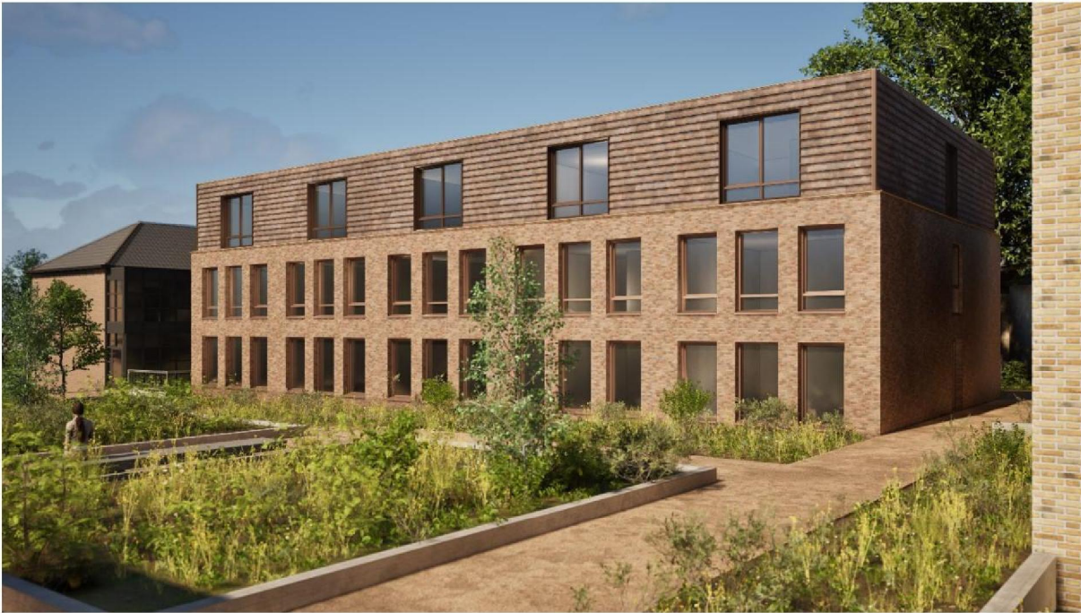
Figuur 6: Uitbreiding van het bestaande gebouw Zilverheuvel