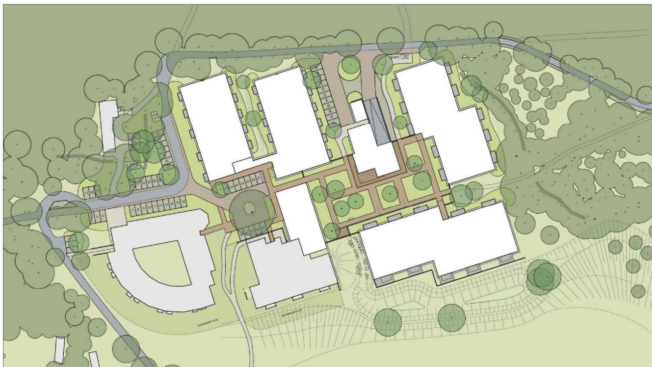
Figure 1: Overzichtsplattegrond