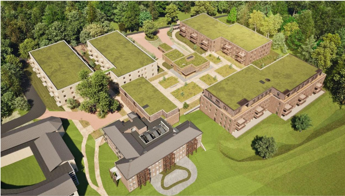
Figuur 2: Vogelvlucht