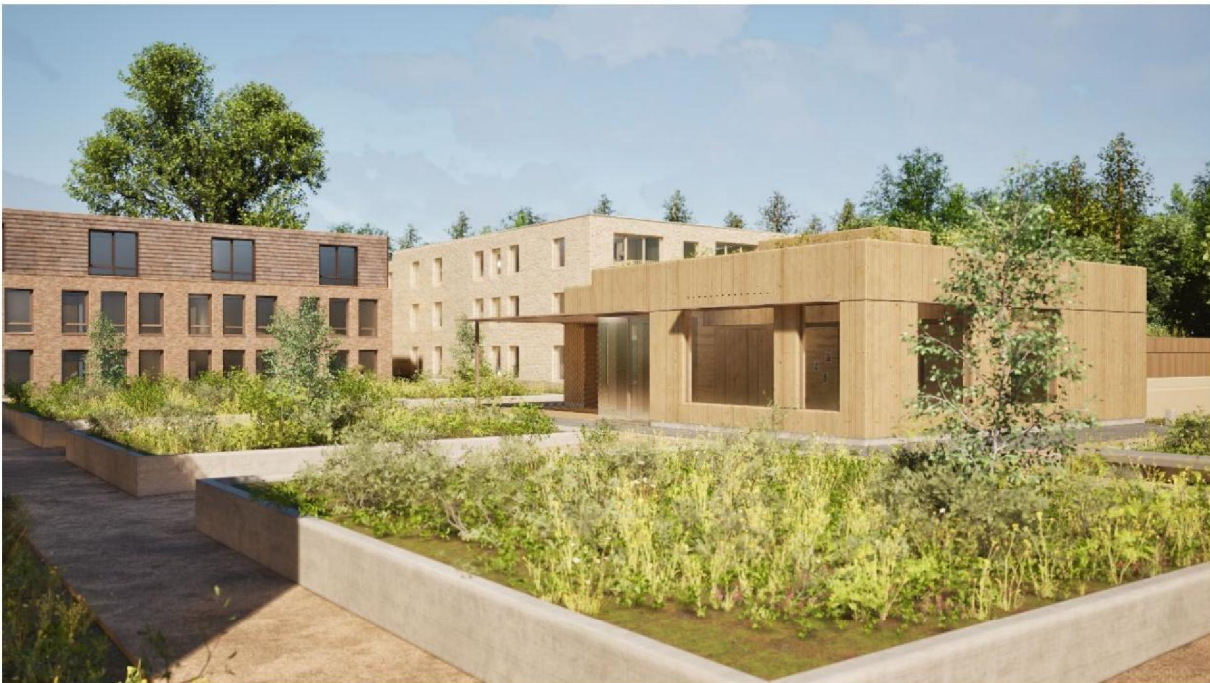
Figuur 5: Paviljoen in de binnentuin