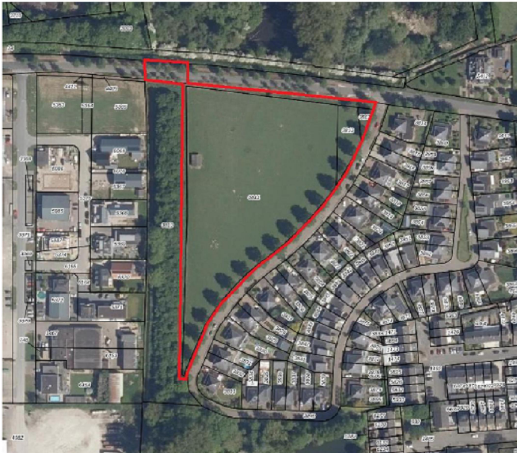
Globale begrenzing plangebied (rode omkadering)

Kaartje van het plangebied of LINK, d.w.z. het gebied waar de bestemmingswijziging voorzien is. Graag exact de grenzen aangeven, het liefst met luchtfoto-ondergrond.