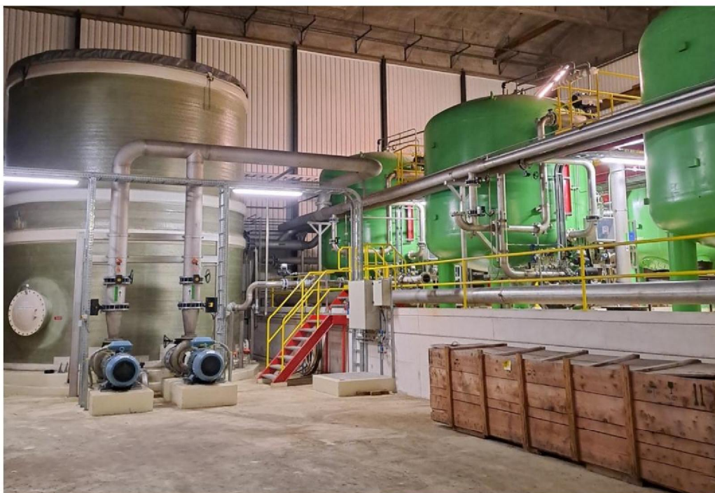
Afbeelding 5.2: Beoogde locatie pilotinstallatie in ontijzeringshal

Het ontwerp voor de pilotinstallatie is grotendeels gereed. De installatie maakt gebruik van rivierwater dat via het bestaande ontrekkingswerk wordt ingenomen. Daarna volgt een continu zandfilter (Dynasand) en een discontinu zandfilter als polishing. Hierna volgt een hygiëne-stap waarbij het water wordt gedesinfecteerd. In het ontwerp is rekening gehouden met het bijschakelen van optionele componenten. Zo kan desgewenst aanvullend nog een desinfectiemiddel worden toegevoegd en ook is een doseermogelijkheid voorzien voor het eventueel toevoegen van een coagulant. De pilotinstallatie zal modulair worden opgebouwd zodat op basis van de resultaten eenvoudig kan worden geoptimaliseerd. Als locatie voor de installatie is de huidige ontijzeringshal geselecteerd. Op deze locatie staan de zandfilters opgesteld voor de behandeling van grondwater. Deze filters kunnen mogelijk in de toekomst geschikt worden gemaakt voor de behandeling van oppervlaktewater. Vanuit de ontijzeringshal is het een relatief korte afstand naar de pijpenbrug waar de geselecteerde leiding naar de PM2 onderdeel van uitmaakt. Een proces flow diagram is opgenomen in bijlage 1.