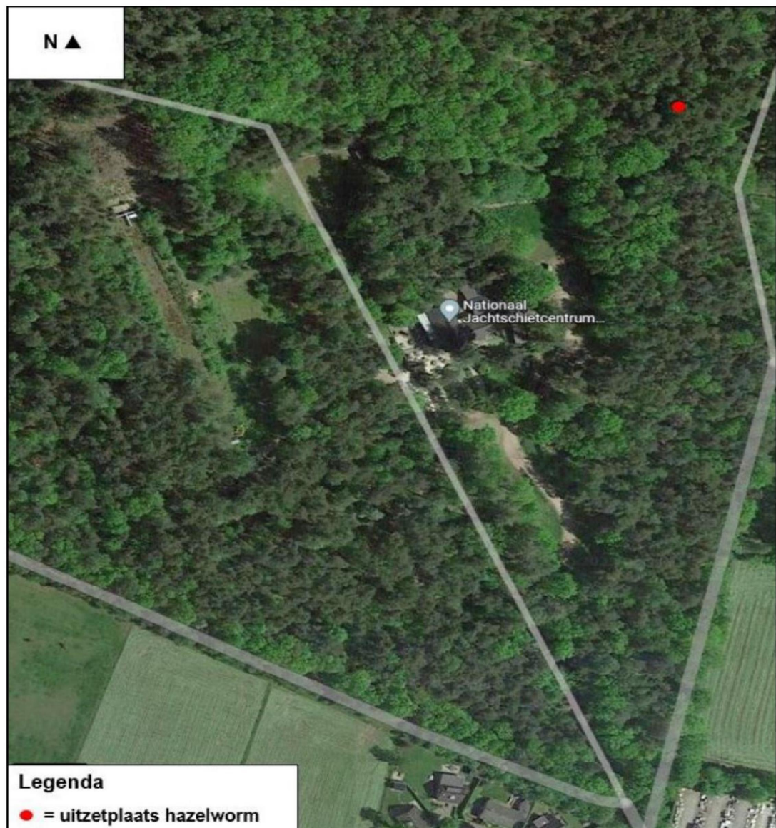
Figuur 2. De locatie waar eventueel gevangen hazelwormen buiten het plangebied en de werkzaamheden worden uitgezet (met een rode stip weergegeven).