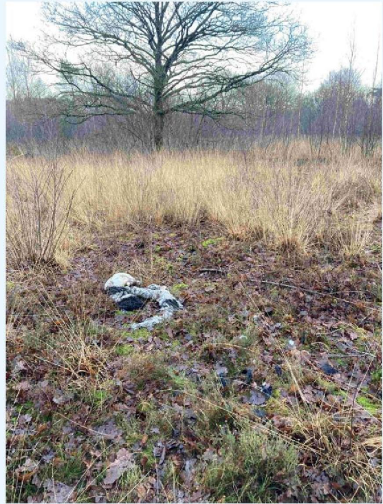
schaap 6 ver weggesleept.JPG