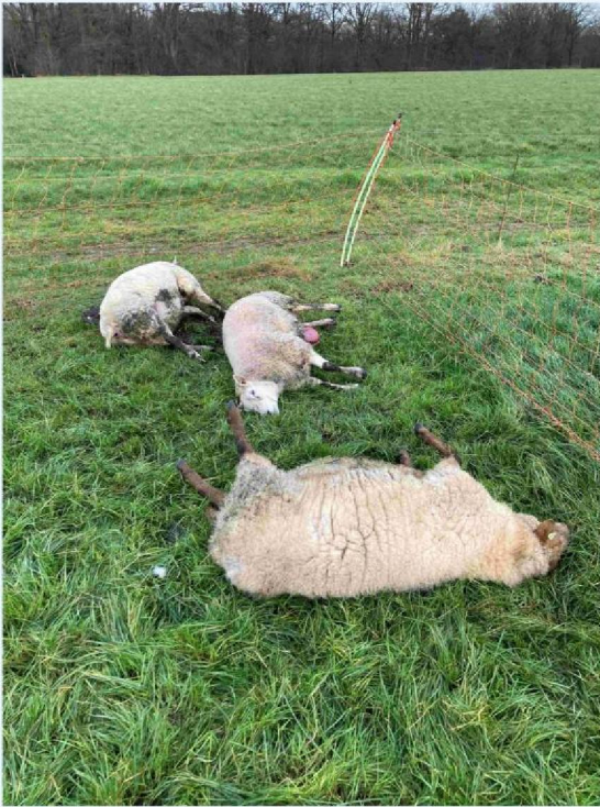
schaap 1, 2 en 3 (1+3 ge  uthanaseerd).JPG