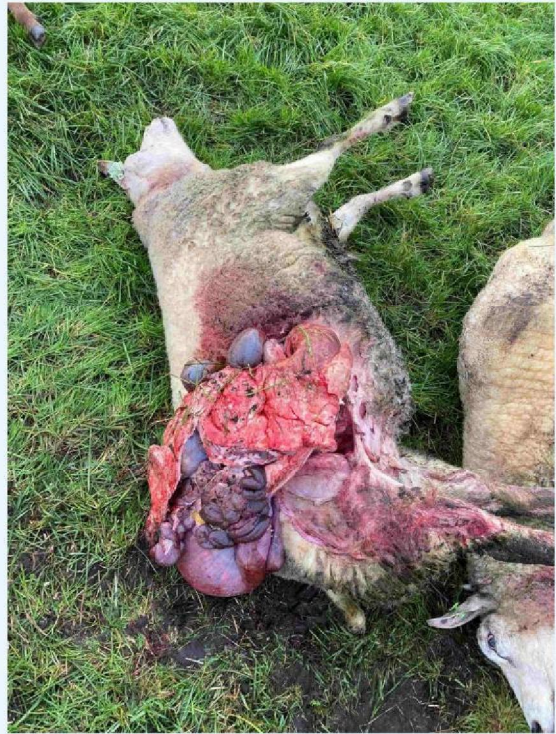
schaap 2 vraatbeeld.JPG