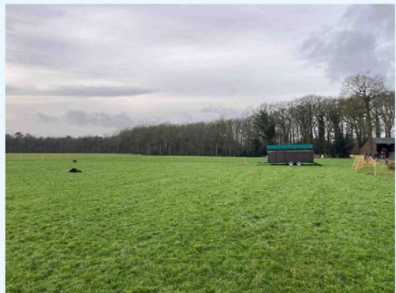
schaap 4 en 5.JPG