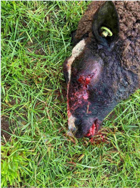
schaap 5 kopbeet.JPG