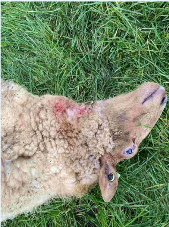
schaap 3 keelbeet.JPG