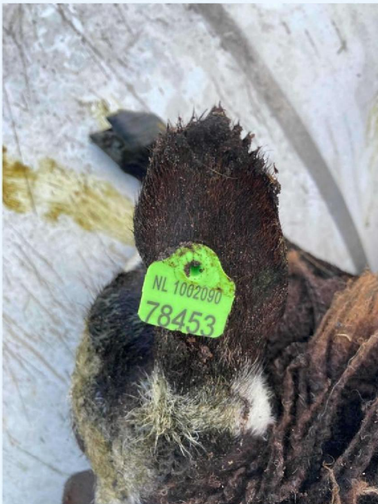
schaap 7 en 8 geëuthanaseerd.JPG