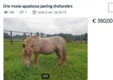
Vraagprijs vergelijkbare dieren.jpg