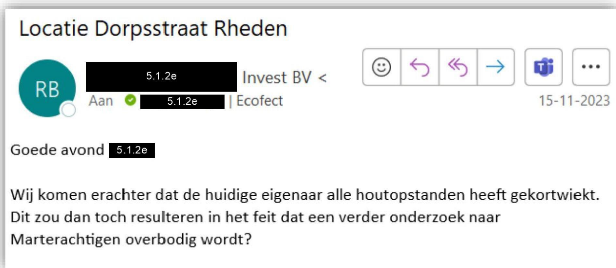
Screenshot mail initiatiefnemer met de aanleiding voor het aanpassen rapport

Recapitulerend was ik op de hoogte gebracht door opdrachtgever betreffende het verwijderen van de begroeiing. Op 15 november 2023 ben ik daarvan op de hoogte gesteld en op verzoek de Quicksan aangepast. Derhalve heb ik de Quicksan aangepast op dit onderdeel omdat de potentie niet meer aanwezig is betreffende de marterachtigen. Hier had ik anders mee om moeten gaan en de Quicksan niet aan moeten passen.