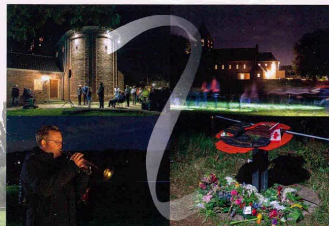
Sleerfoto's tijdens de stilletocht.

De stille tocht wordt bij het monument afgesloten met het spelen van de Last Post en is tevens de officiële afsluiting van de Airborne herdenkingen binnen de gemeente Renkum.