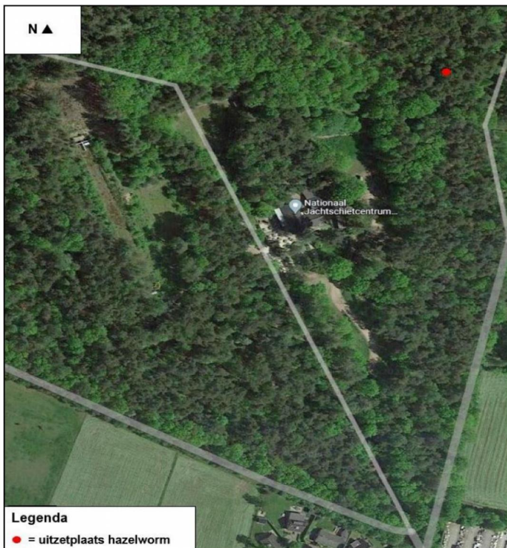
Figuur 2. De locatie waar eventueel gevangen hazelwormen buiten het plangebied en de werkzaamheden worden uitgezet (met een rode stip weergegeven).