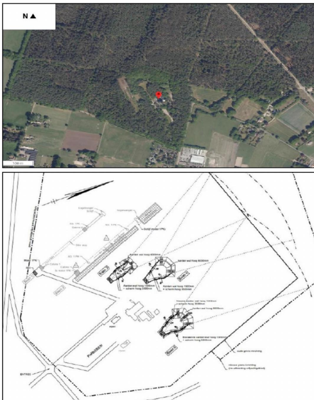
Figuur 1. De ligging en begrenzing van het plangebied De Berkenhorst aan de Stakenbergweg 60 te Elspeet. Op de onderste afbeelding is een indicatie van de ligging van de drie schietbanen weergegeven.