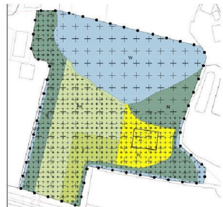
Figuur 2. Verbeelding ontwerpbestemmingsplan.

Er is in het ontwerp bestemmingsplan alleen een verbeelding waarop de begrenzing van GNN lijkt te zijn aangepast. Een deel van het GNN heeft de bestemming 'wonen' en 'agraris met waarden'. Daarbij is het water van het wiel bestemd als 'water', overeenkomstig de vigerende bestemming. De verbeelding dient aangepast te worden. Het GNN in het nieuw vast te stellen bestemmingsplan dient passend bestemd te worden. Het wiel moet daarom net als aangrenzende GNN-delen de bestemming natuur krijgen. Anders kan niet worden ingestemd met het plan.