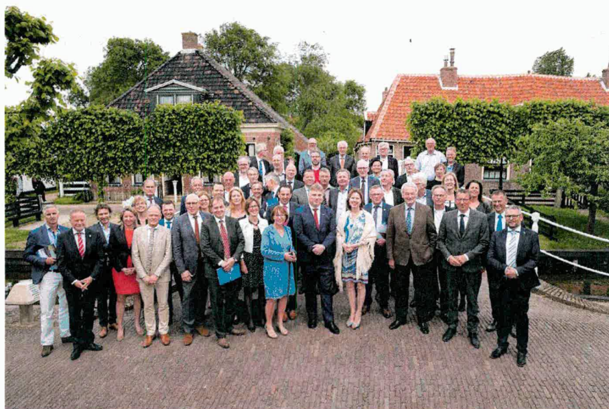
Ruim 60 partijen ondertekenden in mei 2018 de Agenda IJsselmeergebied 2050.

De gebiedsagenda is het resultaat van een ruim twee jaar durend proces met alle gebiedspartijen: rijksoverheid, provincies, gemeenten, waterschappen, maatschappelijke organisaties, bedrijfsleven en burgers.