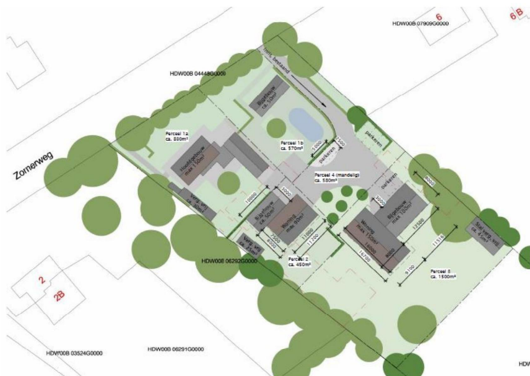
Nieuwe situatie bebouwing

Alle woningen krijgen hun eigen behorende bouwwerken. Voor de hoofdwoning gaat het daarbij om maximaal 50m 2 , voor de grote woning om maximaal 100m 2 en voor de middelgrote woning om maximaal 60m 2 . Daarbij is de goot- en bouwhoogte vastgesteld op 3 en 4,5 meter. Eventuele aanvullende vergunningsvrije bouwwerken worden gerealiseerd als de Omgevingswet dit toelaat.