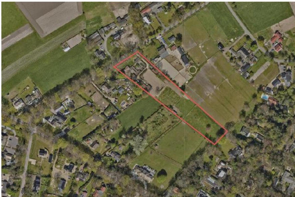
Ligging projectgebied aan de Zomerweg

Het perceel ligt met de voorzijde aan de Zomerweg en grenst aan de achterzijde aan de percelen van de Biestenweg. In de huidige situatie wordt dit perceel bewoond en worden paarden gehouden.