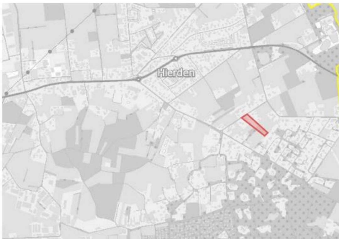
Ligging projectgebied in Hierden

Het perceel waar de herontwikkeling plaatsvindt betreft Zomerweg 4 te Hierden, kadastraal bekend als HDW00B3529 ligt in het buitengebied van Hierden, ten zuidwesten van de dorpskern. In de volgende afbeelding in rood aangegeven.