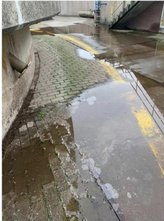
Foto van de kapotte flens, toegestuurd door SMURFIT KAPPA PARENCO B.V. op 5 maart 2021: