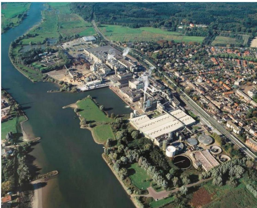
Figuur 1 Locatie van SK Parenco tussen het Renkums Beekdal, de Nederrijn en het dorp Renkum.