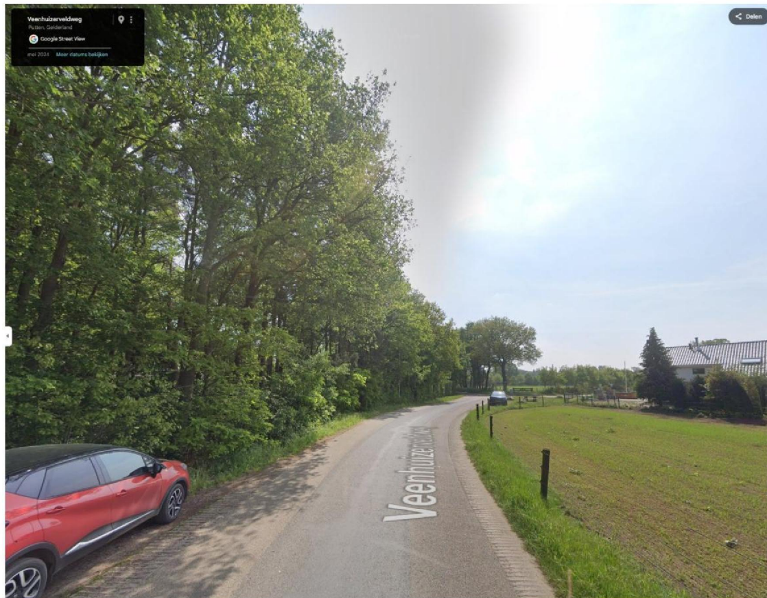
Afbeelding 5: screenshot googlemaps.nl: uitzicht vanuit woning eiser op weg en bosstrook