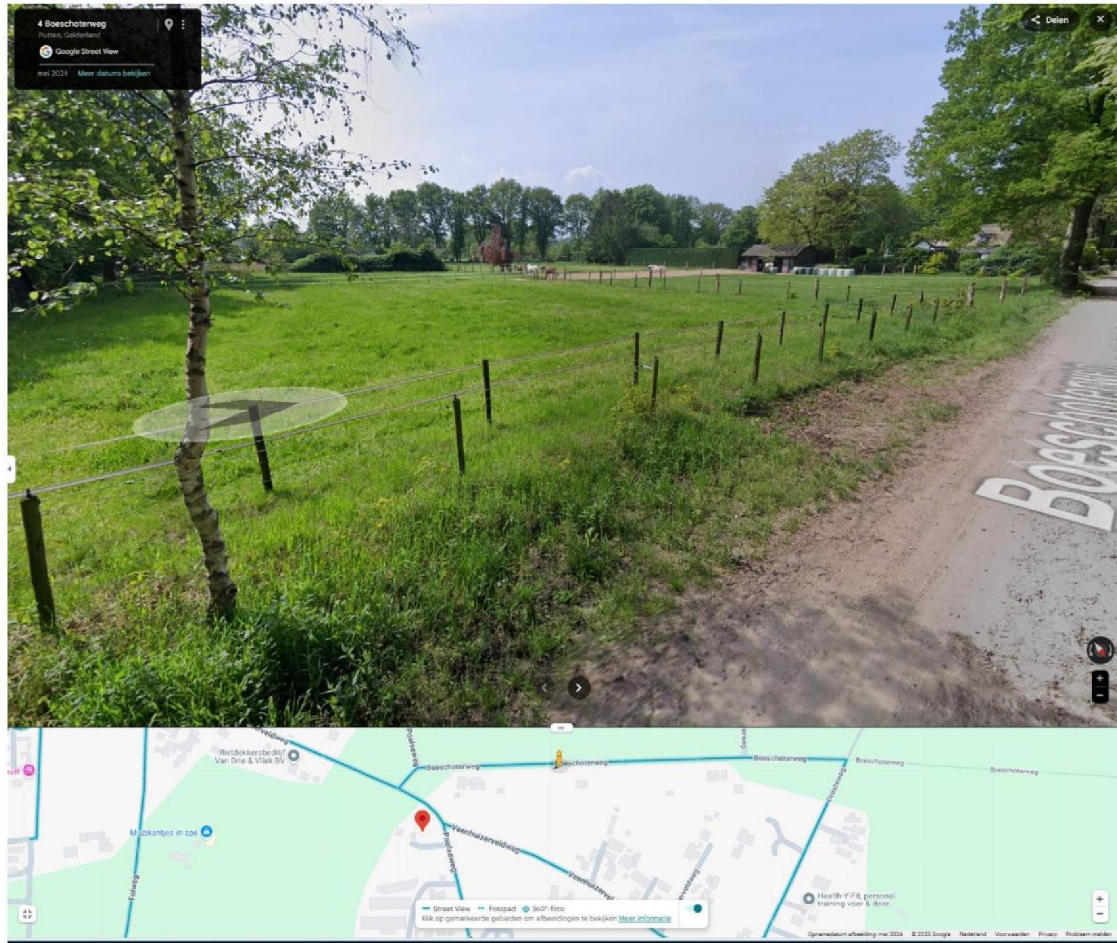
Afbeelding 7: screenshot googlemaps.nl: uitzicht vanuit Natura 2000-gebied de Veluwe ter hoogte van de Boeschoterweg richting woning eiser

Afbeeldingen 1 tot en met 7 laten zien dat eiser geen direct zicht heeft op het Natura 2000-gebied de Veluwe. Tussen de woning en het Natura 2000-gebied ligt een weg, een grote, dichte bosstrook en in noordoostelijke richting een andere woning/boerderij, waardoor het directe zicht op het achterliggende Natura 2000-gebied in elk geval vanuit de leefruimten en de buitenruimte van de woning wordt weggenomen. Onder deze omstandigheden zijn wij van mening dat het betreffende Natura 2000-gebied de Veluwe geen deel uitmaakt van de leefomgeving van eiser. Wij verwijzen in dit verband ook naar de uitspraak van de Afdeling van 19 maart 2025, ECLI:NL:RVS:2025:1183, rechtsoverweging 18.4. De omstandigheden in de situatie van eiser zijn op essentiële punten vergelijkbaar met de omstandigheden in deze uitspraak waarin de Afdeling concludeerde dat het betreffende Natura 2000-gebied geen deel uitmaakte van de leefomgeving van appellant. In die zaak was er, ondanks de relatief korte afstand tot het Natura 2000-gebied, vrijwel geen direct zicht op het Natura 2000-gebied in elk geval vanuit de leefruimten op de begane grond en de buitenruimte van de woning. Bovendien was het Natura 2000-gebied van appellant in die zaak niet binnen de hemelsbreed gemeten afstand te bereiken. Een vergelijkbare situatie doet zich voor ten aanzien van de woning van [redacted] met name vanwege de tussengelegen bosstrook en de ligging van de (toegangs)weg naar de Veluwe.