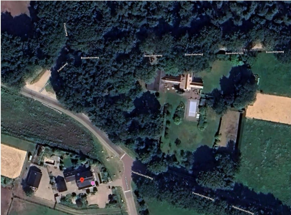
Afbeelding 3: screenshot googlemaps.nl: bovenaanzicht situering woning eiser, daarbij relevant de aanwezigheid van een weg, bosstroken en andere bebouwing t.o.v. Natura 2000-gebied de Vehuwe