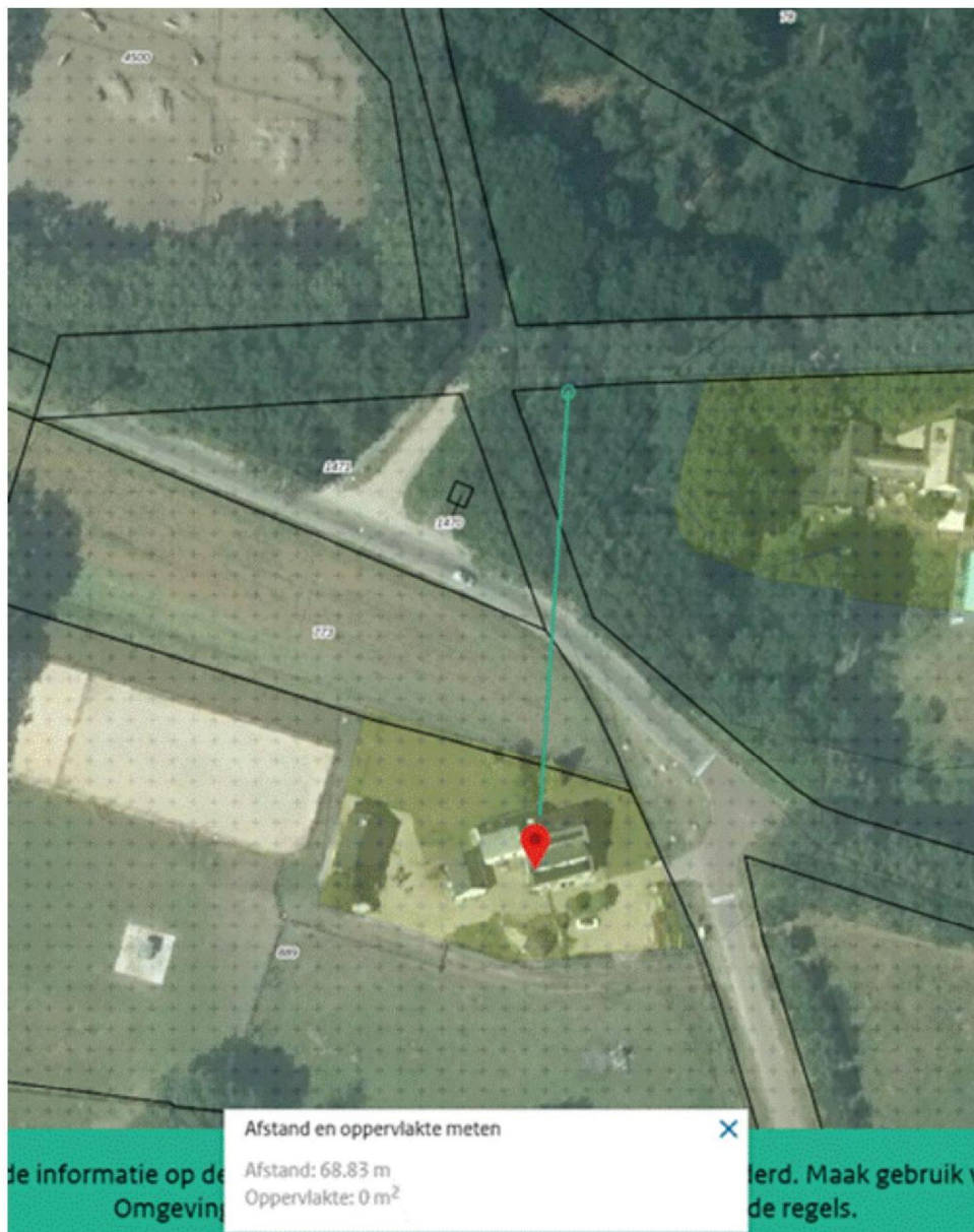
Afbeelding 2: screenshot ruimtelijkeplannen.nl: afstand woning t.o.v. de Veluwe