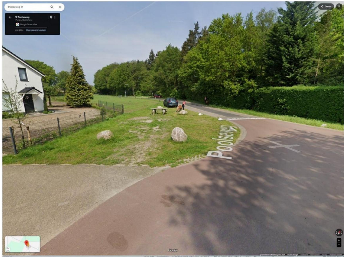
Afbeelding 4: screenshot googlemaps.nl: uitzicht vanuit woning eiser op weg en bosstrook