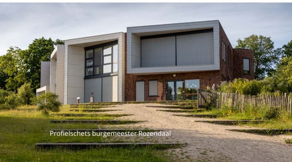
Profielschets burgemeester Rozendaal