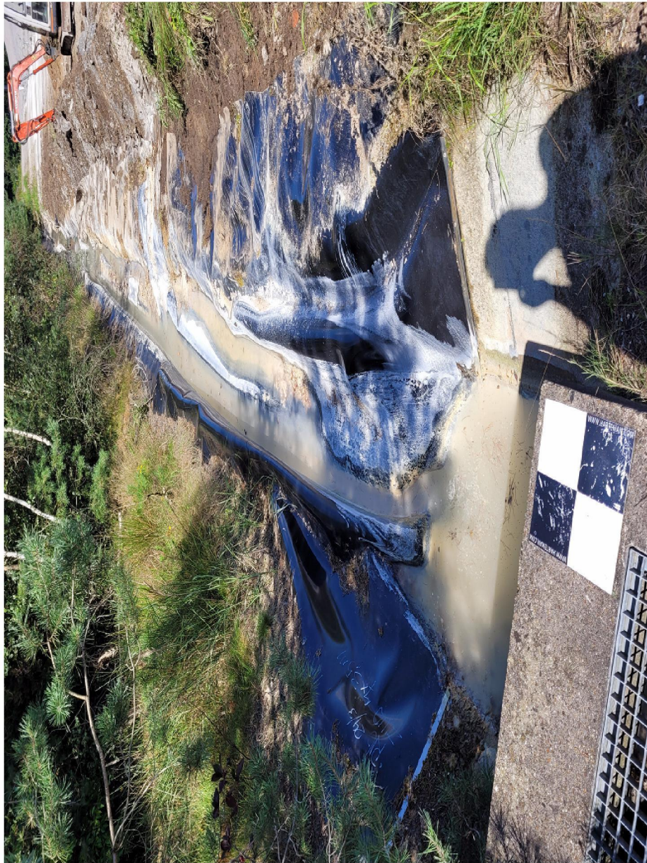
2. Herstelwerkzaamheden vanaf verzamelput over een lengte van circa 40 m 1 .