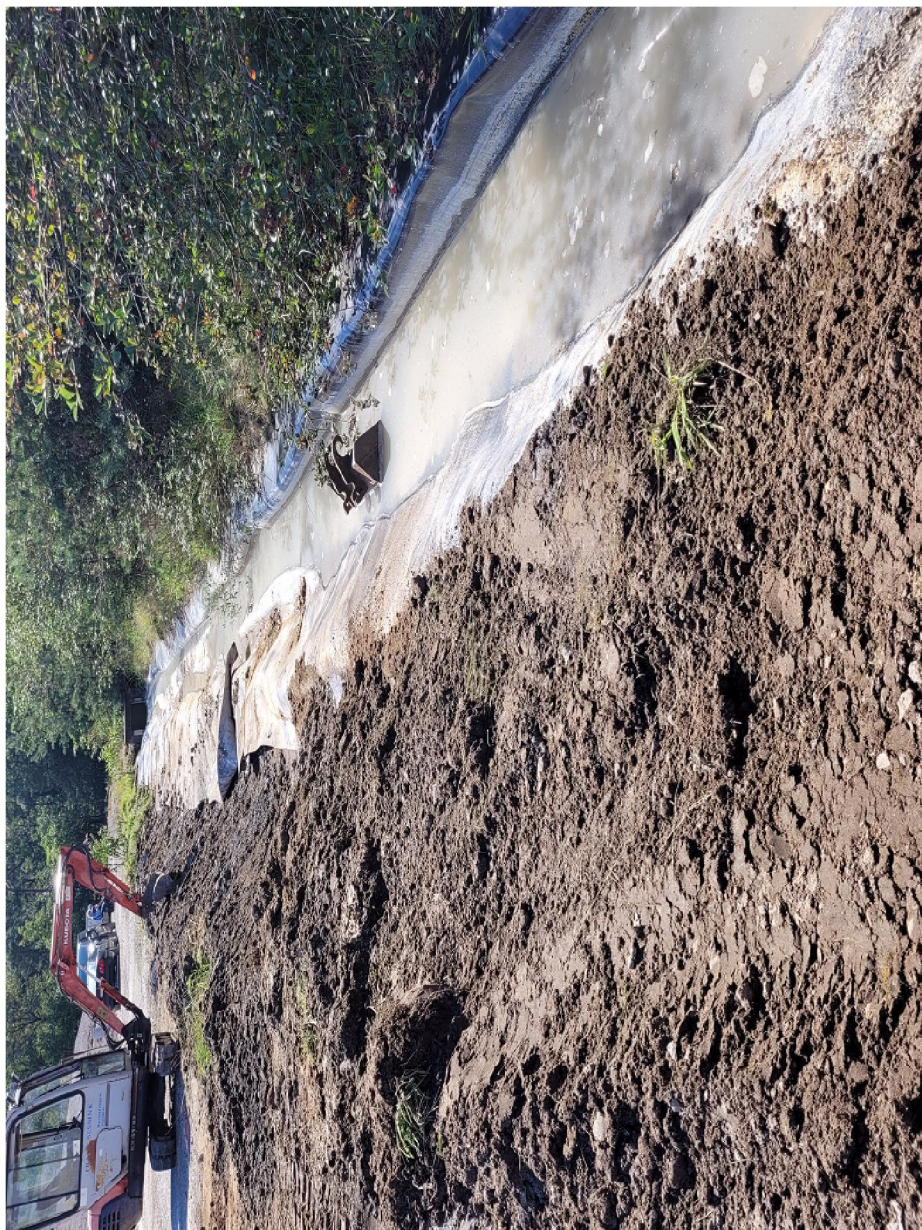
Herstelwerkzaamheden over een lengte van circa 40 m 1 tot aan verzamelput. Graafbak in sloot om vloeistof onder het folie weg te drukken.