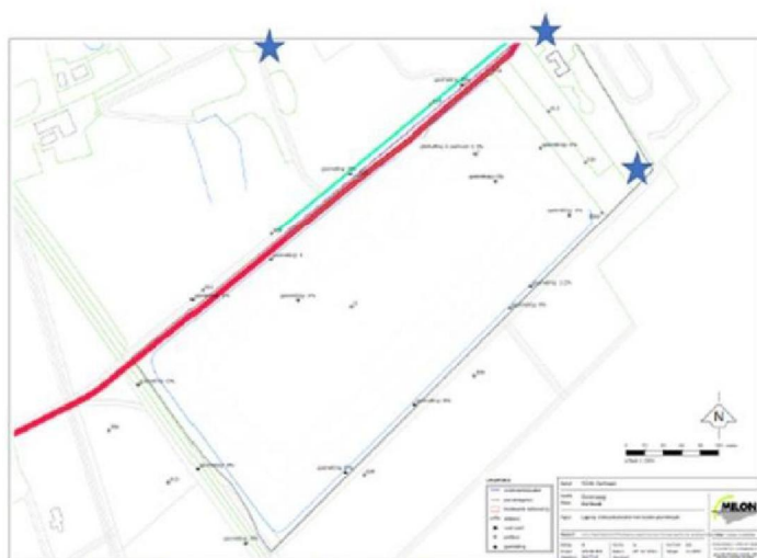
Figuur 2: locaties drie aanvullende peilbuizen met twee filters (niet op schaal)