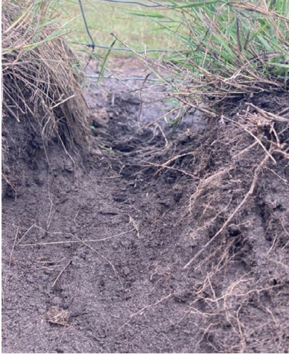
Probleem: een dassenwissel onder het raster