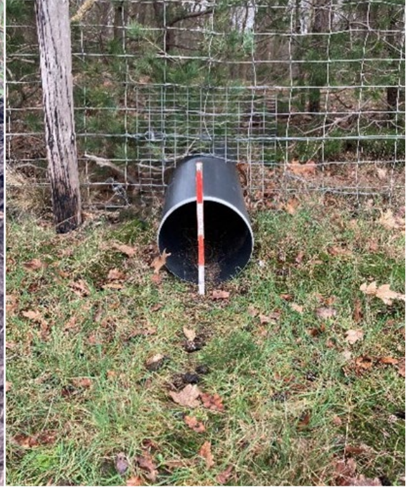
Oplossing: buis onder het raster