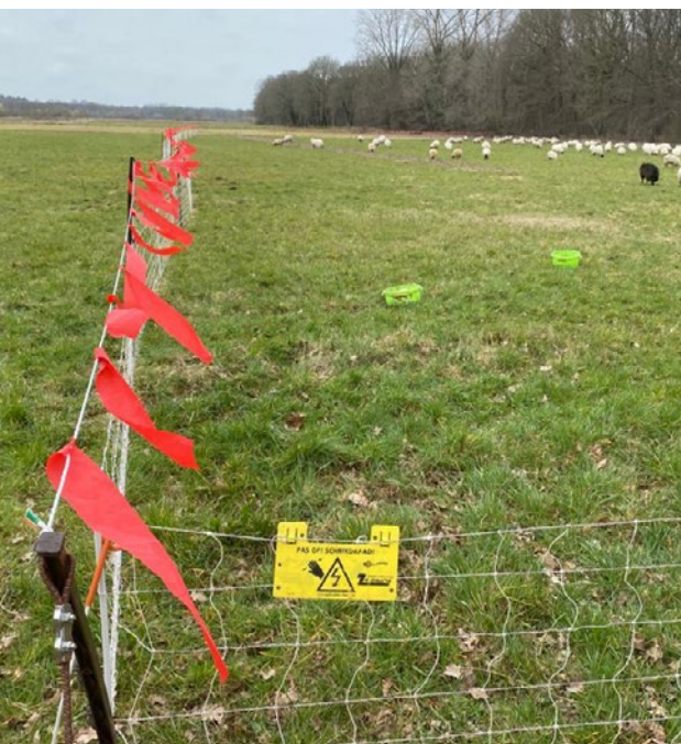
Fladrie bestaat uit een stroomhoudend koord waaraan linten zijn bevestigd.