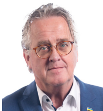
Bert Heideveld Kerk-Avezaath