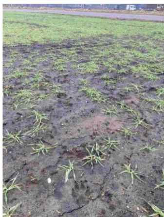
Spoor/ prenten richting weiland van de schapen op achtergrond