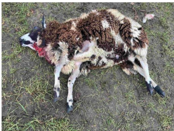
Schaap 4 (geëthanaseerd)