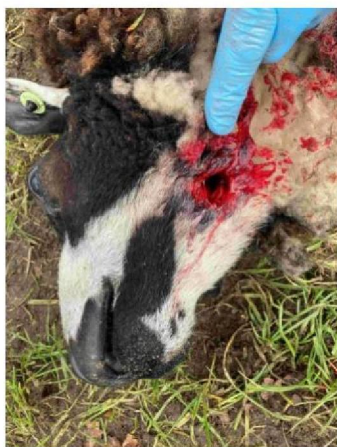
Schaap 4 keelbeet