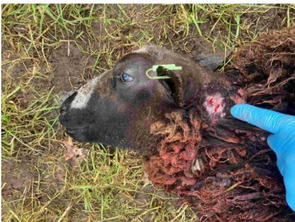
Schaap 3 keel/nekbeet