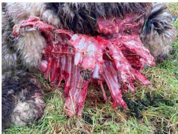
Schaap 1 vraatbeeld 1