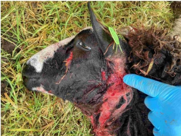
Schaap 2 verwondingen kop (als gevolg van keelbeet)