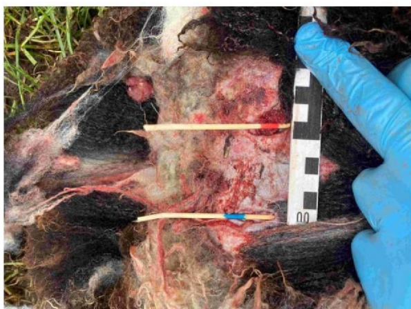
Schaap 4 gemeten beet