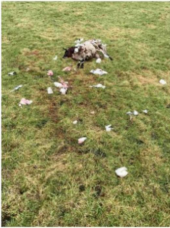
Schaap 2 sleepspoor