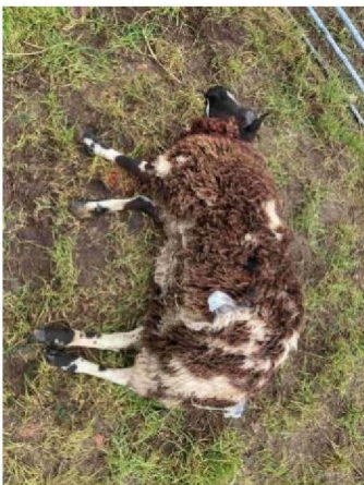
Schaap 3 (geëuthanaseerd)