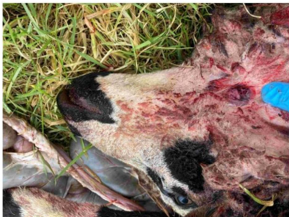
Schaap 1 keelbeet