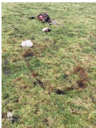
Schaap 1 sleepspoor en pens