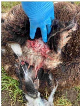
Schaap 3 vraatbeeld op rug (dier liep/leefde nog)