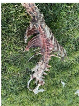
Resten van schaap