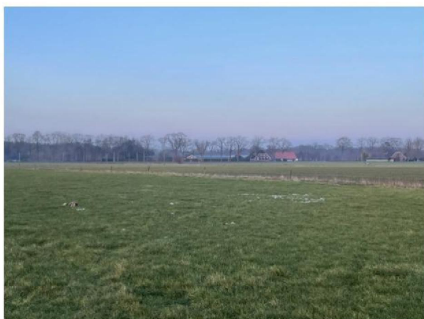
Wol verspreid over weiland