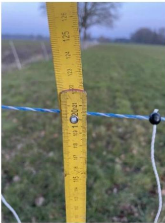
Hoogte raster: 120 cm