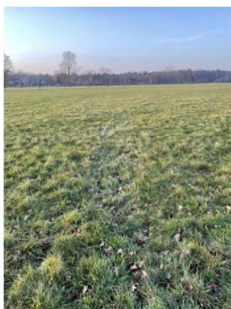
Sleepspoor vanaf flexnet naar weiland daarachter