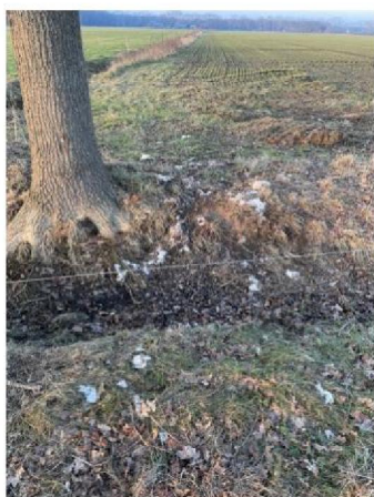
Wol naast flexnet van dood schaap