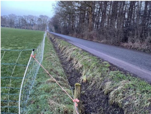
Flexnet aan voorzijde