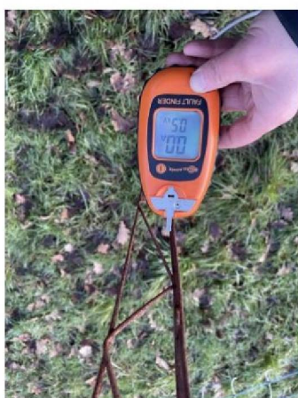
Spanning aardpen: 0,5 kV