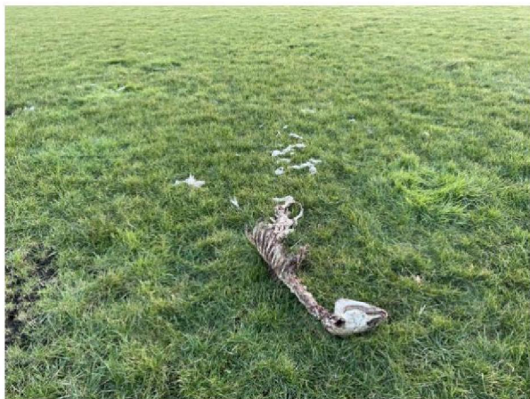
Wol en resten van schaap