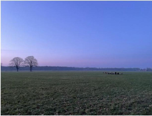
Weiland met schapen