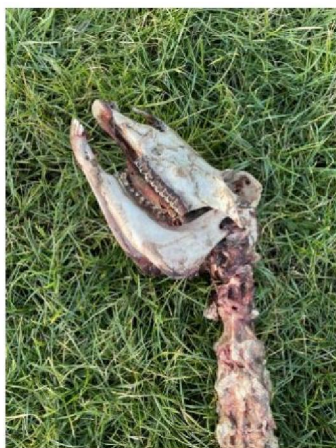
Resten van schaap