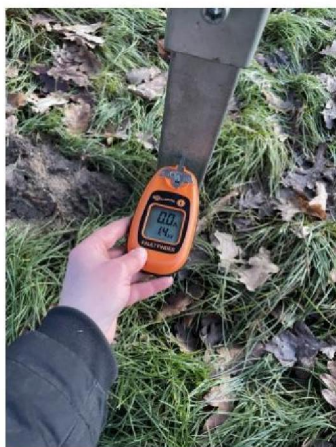
Spanning op kast schrikdraadapparaat: 1.4 kV