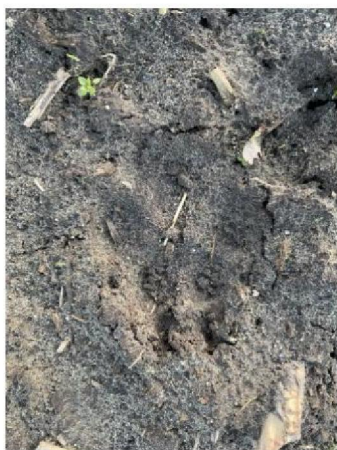
Pootafdruk in bouwland