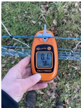
Spanning raster: 7.8 kV