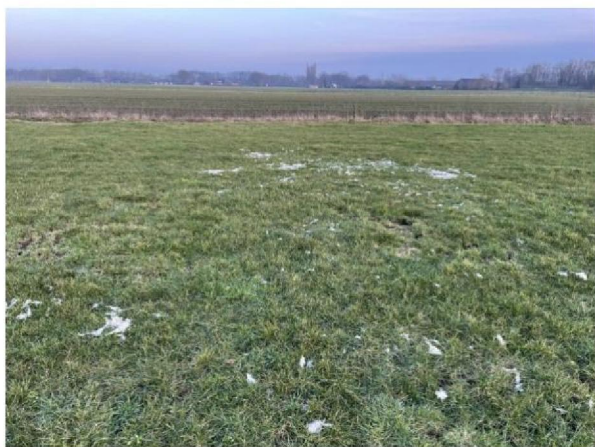
Wol in weiland