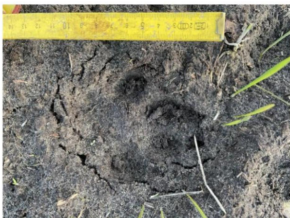
Pootafdrukken in bouwland achterzijde