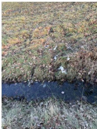
Wolsporen (schaap is door sloot getrokken)