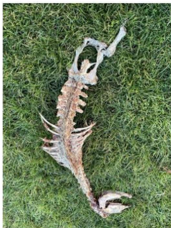
Resten van schaap