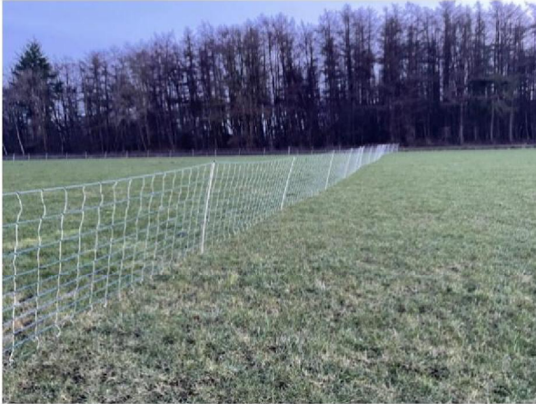
Flexnet aan linkerzijde