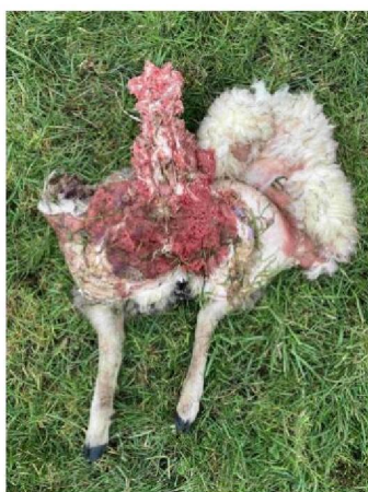
Restanten schaap foto 3