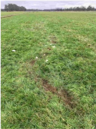
Pens met ingewanden schaap 1