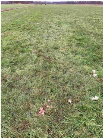
Sleepspoor zonder schaap met restanten schaap 2