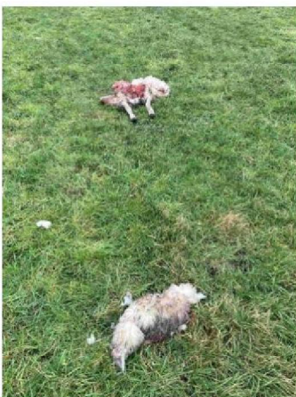
Restanten schaap foto 1