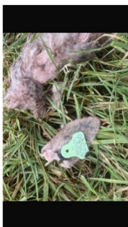
Oor met oornummer