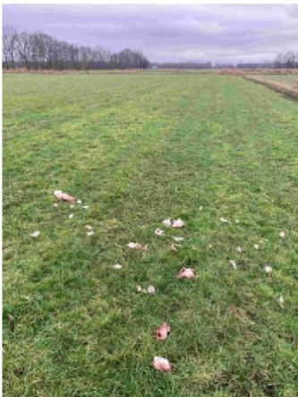
Predatie locatie, mogelijk van schaap 3