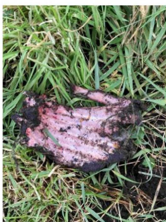
Deel van ribben