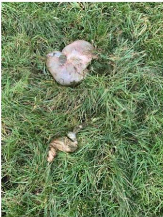
Pens met ingewanden schaap 2