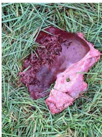
Deel van lever