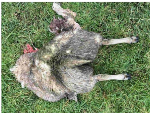
Restanten schaap foto 2