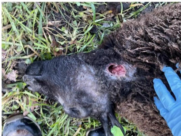
Keelbeet dood schaap 1