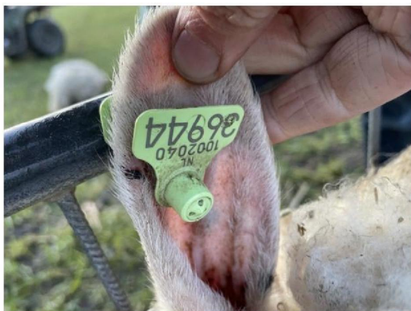
Oormerknummer geëthanaseerd schaap 1