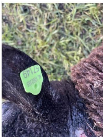
Oormerknummer geëuthanaseerd schaap 2