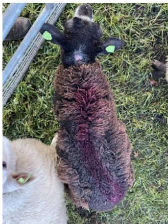
Geëuthanaseerd schaap 2