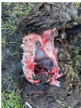
Dood schaap 1