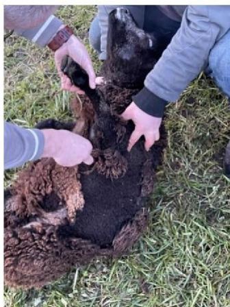
Euthanasie schaap 2