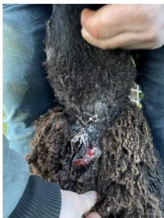
Keelbeet geëuthanaseerd schaap 2