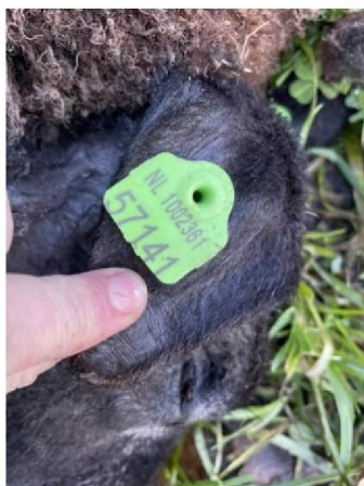
Oormerknummer dood schaap 1