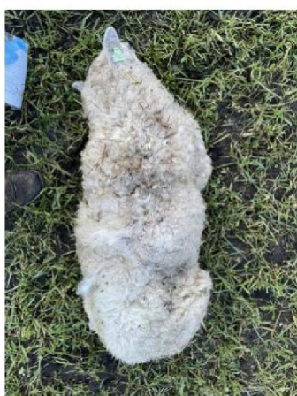
Dood schaap 2 (geen verwondingen)