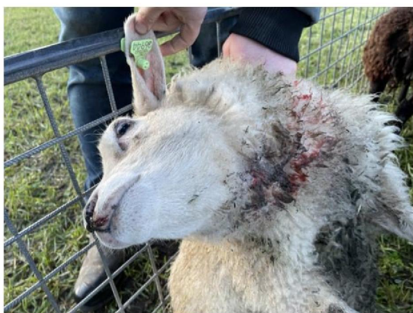
Geëthanaseerd schaap 1