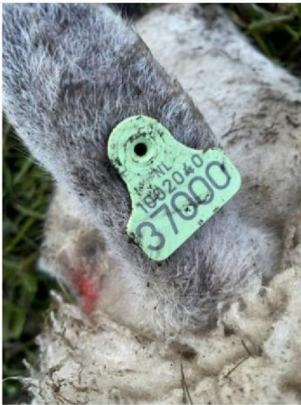
Oormerknummers dood schaap 2