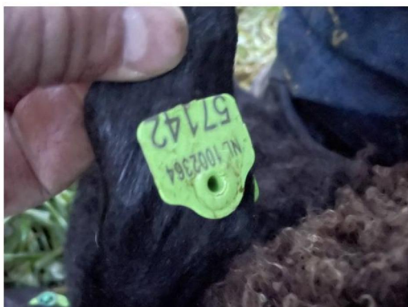
Oormerknummer geëuthanaseerd schaap 3