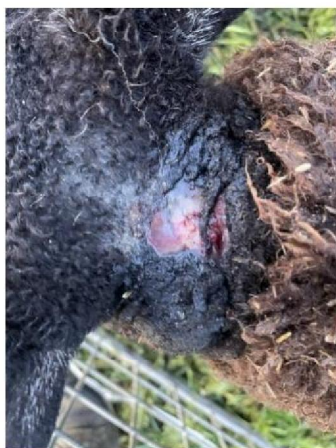
Verwondingen kop geëuthanaseerd schaap 2