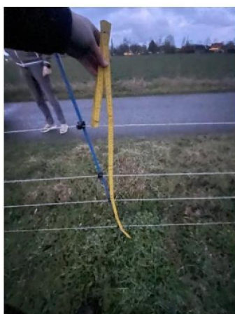
Hoogte raster: 100 cm