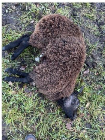
Vraatbeeld dood schaap 1