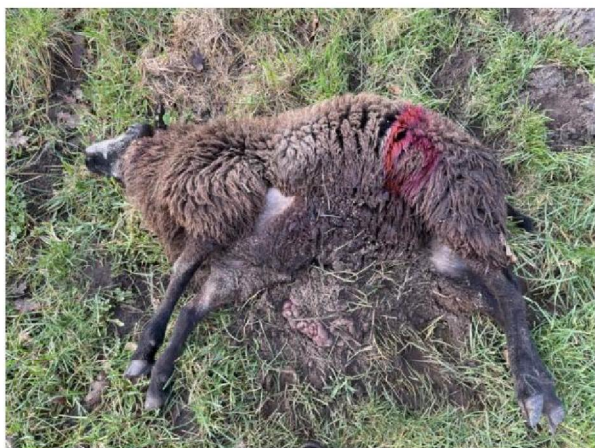
Schaap 6 - deel van schaap (darmen) is begraven door predator