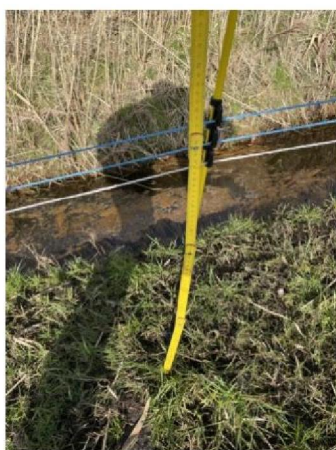
Te grote afstand onderste draad door reeën of predator die onder draad door is gegaan.