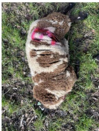
Schaap nummer 9