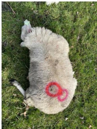
Schaap nummer 8