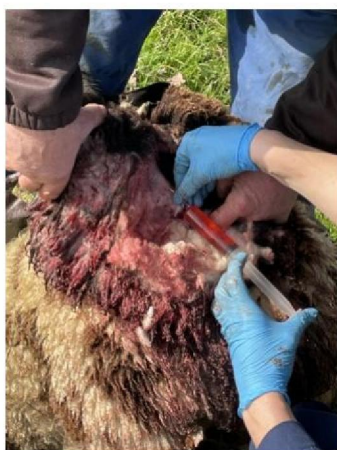
Euthanasie van schaap