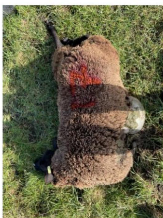
Schaap nummer 17