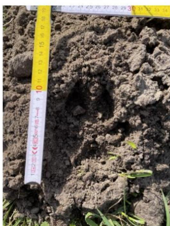
Pootafdruk in weiland