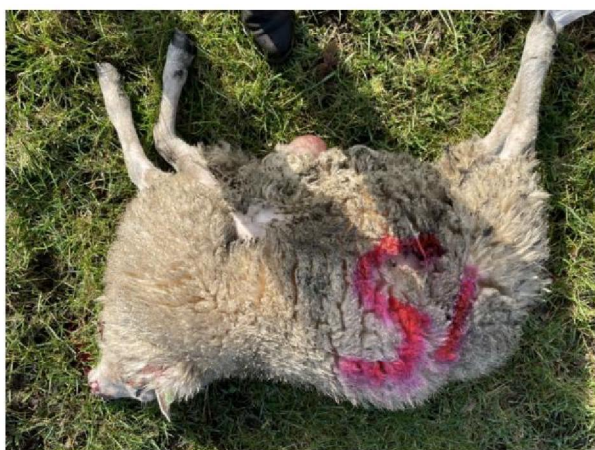
Schaap nummer 15