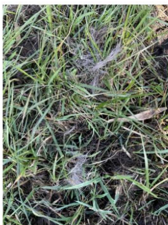
Haar van ree vlakbij wildwissel