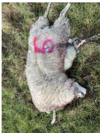
Schaap nummer 5