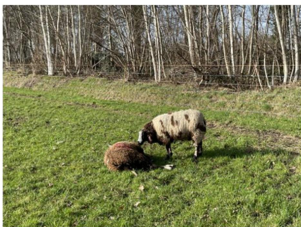
Dood en gewond schaap