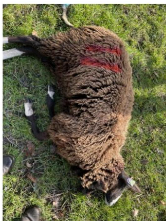
Schaap nummer 11