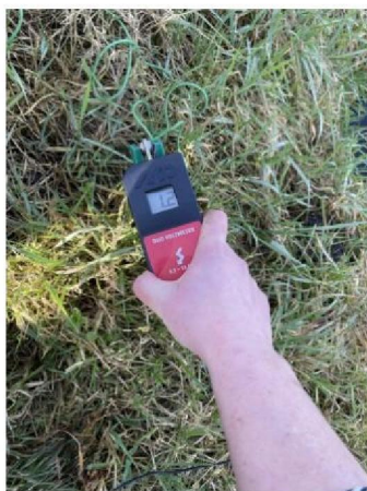
Spanning op aardpen