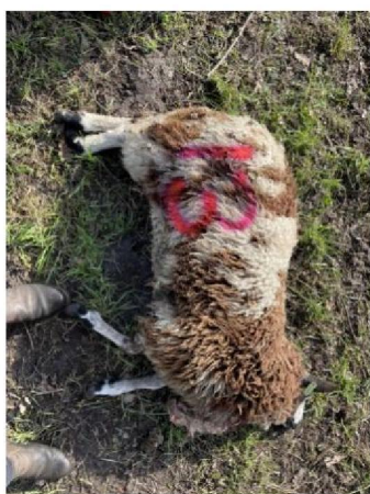
Schaap nummer 13