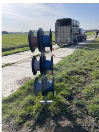
6 draden systeem