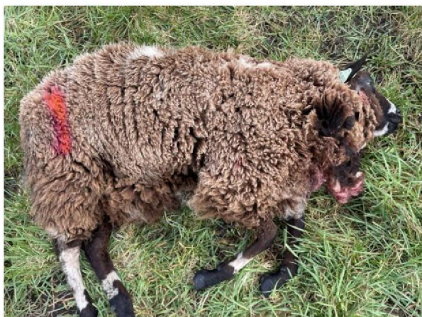
Schaap nummer 1