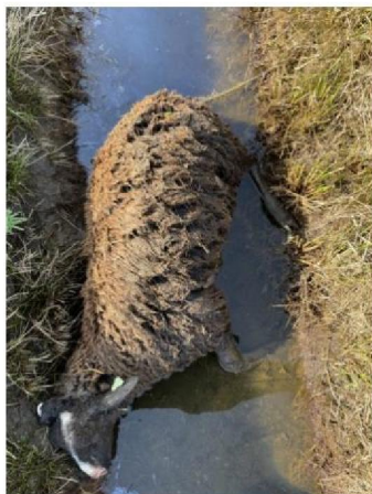
Schaap in greppel