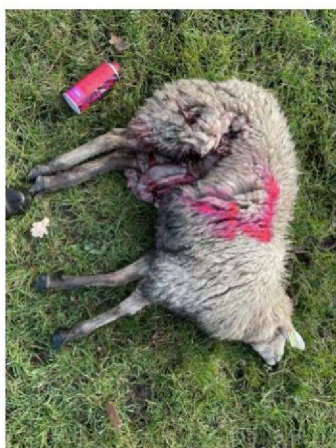
Schaap nummer 7