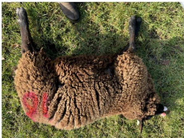
Schaap nummer 16