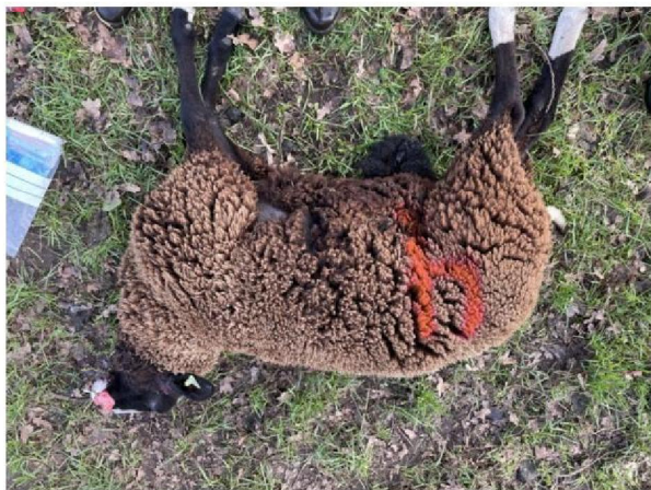
Schaap nummer 4