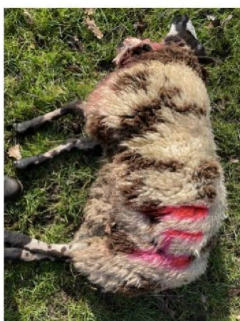
Schaap nummer 14