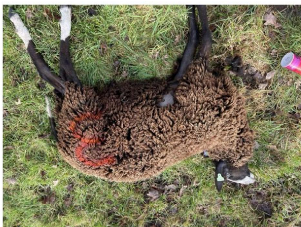
Schaap nummer 3