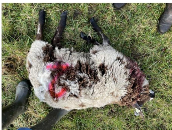
Schaap nummer 2