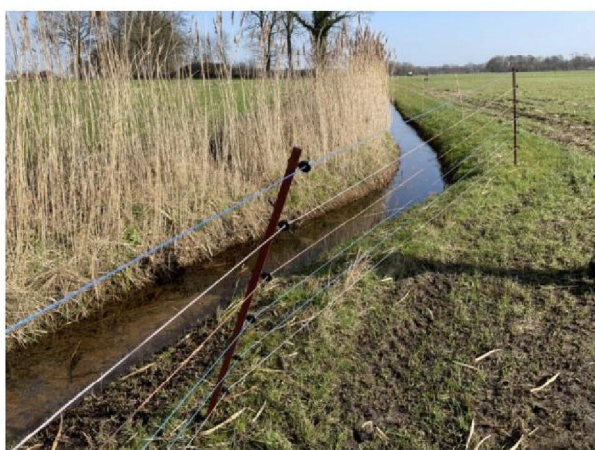
Paal helt naar voren