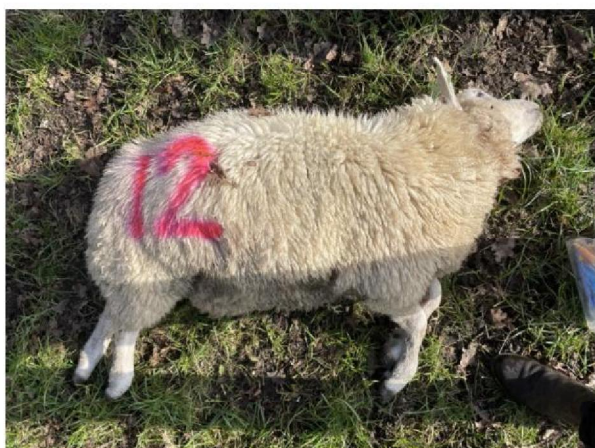
Schaap nummer 12