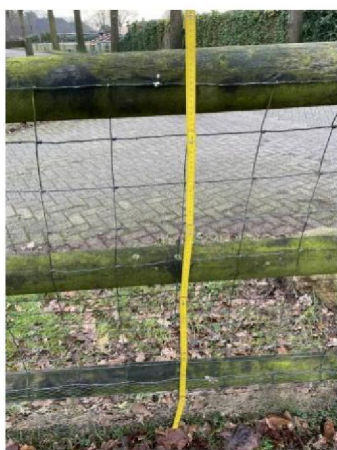
Hoogte van hek