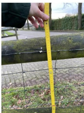
Hoogte: 115 cm