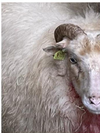
Oormerknummer gewond schaap