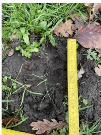
Pootafdruk in weiland