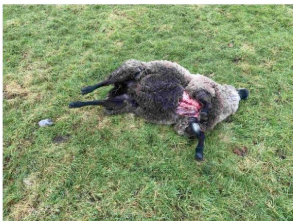
Overzicht schaap met vraatbeeld