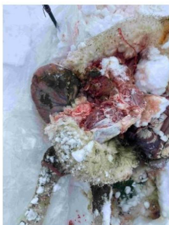
Vraatbeeld achter met meest links de baarmoeder