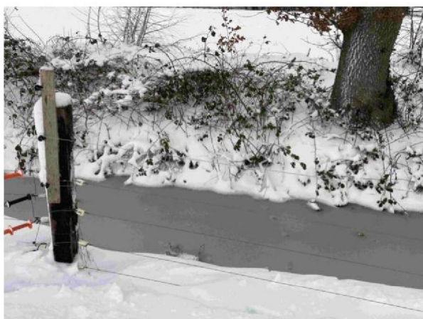
Spoor van mogelijke predator