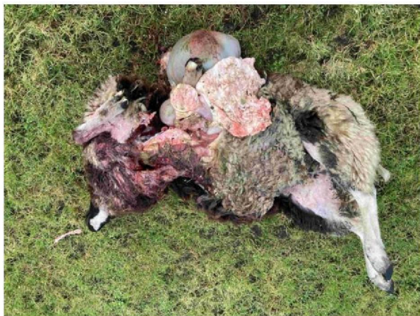
Schaap 2 vraatbeeld 3