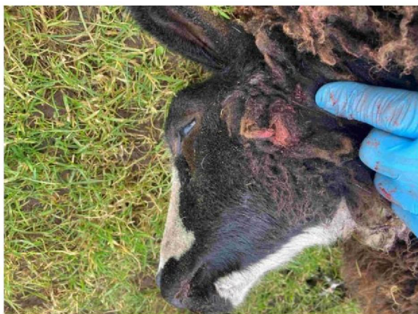
Schaap 2 keelbeet