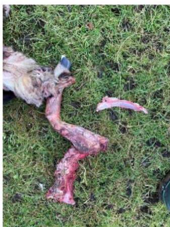
Schaap 2 vraatbeeld 2