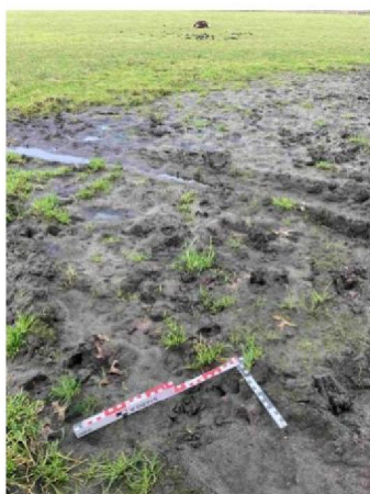
Prenten met een van de schapen op achtergrond