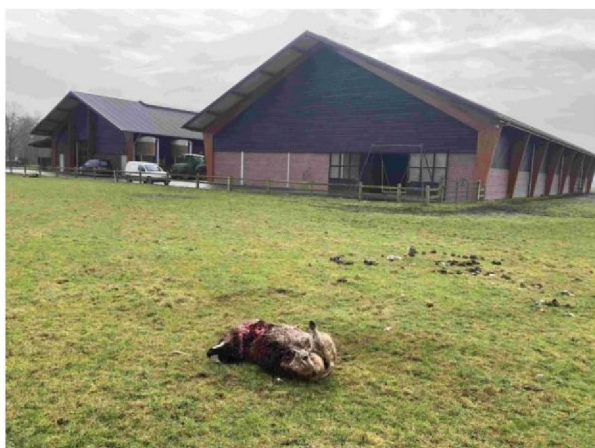
Overzicht weiland foto 2