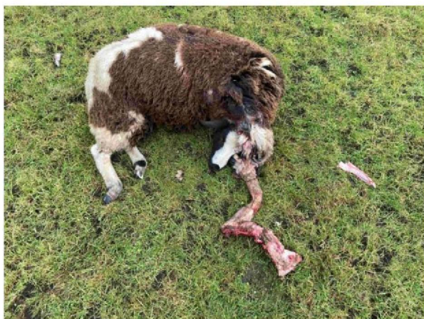
Schaap 2 vraatbeeld 1