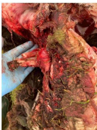
Schaap 2 vraatbeeld 4