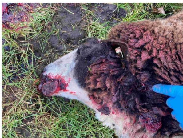
Schaap 1 keelbeet