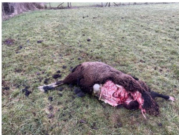
Plukken uitgetrokken wol