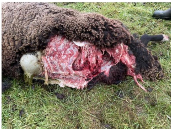
Vraatbeeld dood schaap