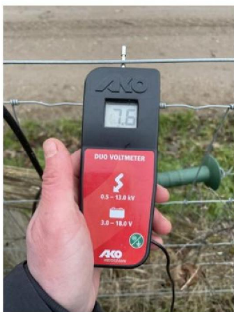
Spanning raster: 7.6 kV