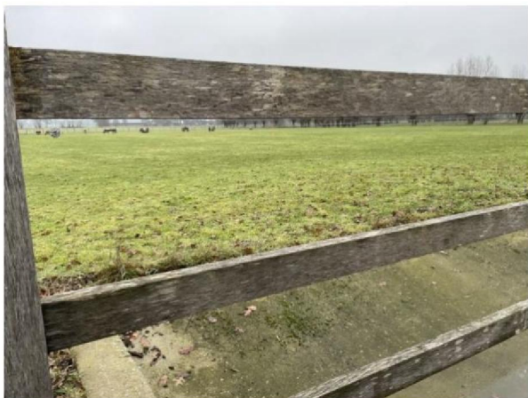
Houten hek met daaronder betonbak bij hygiënesluis.