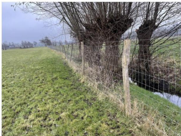
Raster: 1.40 hoog