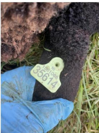
Oormerknummer dood schaap