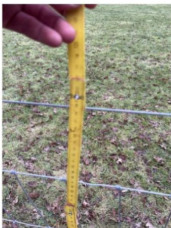
Hoogte raster: 1.20 m