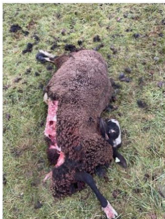
Vraatbeeld dood schaap