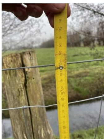
Hoogte raster: 1.40 m