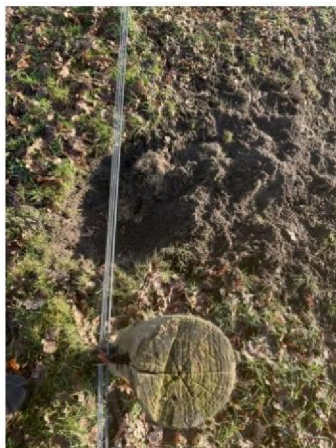
onder raster doorgegraven 3e plek