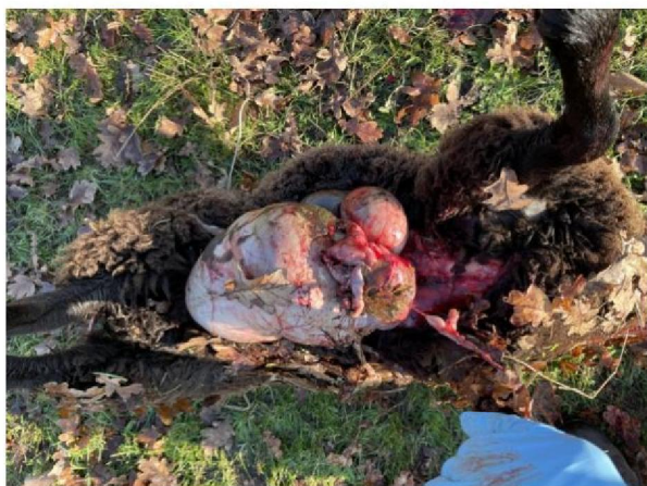
Vraatbeeld dood schaap 6