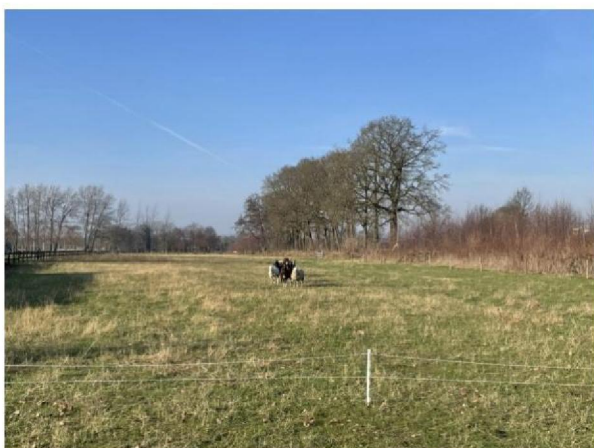
Weiland met schapen, tussendraad stuk gelopen door schapen