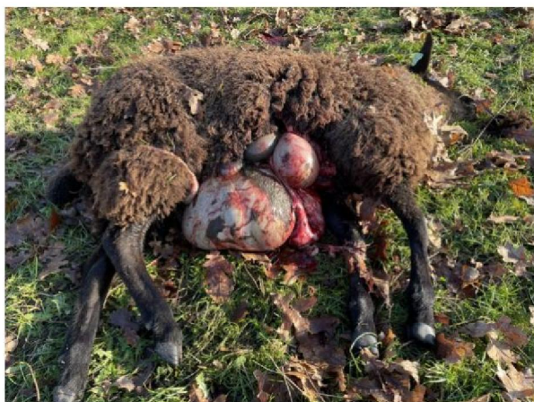
Dood schaap 6