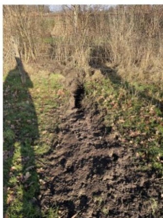
Onder raster door gegraven 2e plek