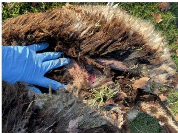
Keelbeet dood schaap 1