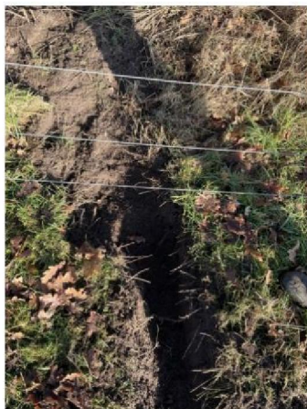
Onder raster door gegraven 2e plek