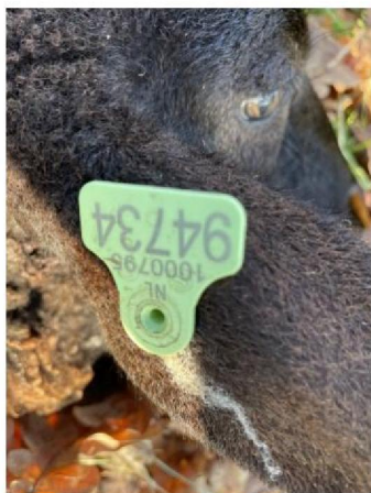
Oormerknummer dood schaap 7