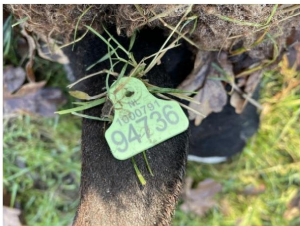
Oormerknummer dood schaap 4