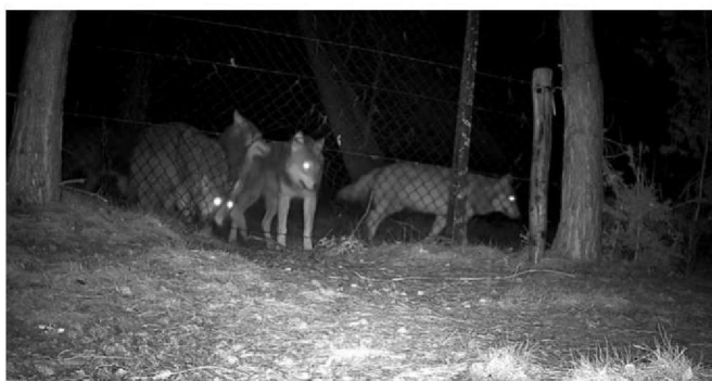
Screenshot van filmpje van wildcamera: roedel wolven in omgeving van aanval (Lunteren).