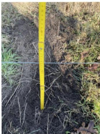
Hoogte onderste draad na onderdoor graven