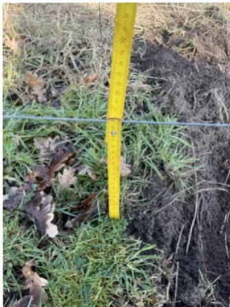
Hoogte onderste draad: 21 cm