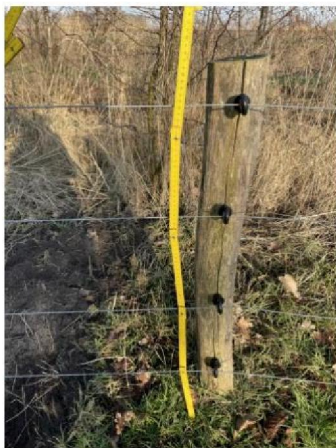
Hoogte raster: 85 cm