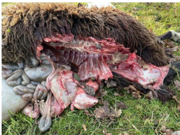
Vraatbeeld dood schaap 2