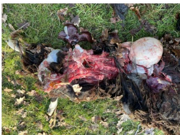
Vraatbeeld dood schaap 5