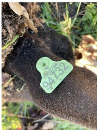
Oormerknummer dood schaap 6