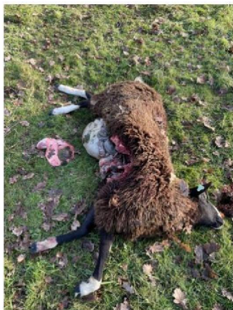
Dood schaap 2