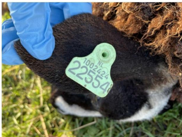
Oormerknummer dood schaap 1