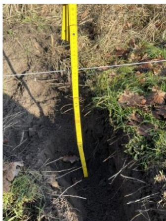
afstand onderste draad na onderdoorgraving