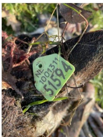
Oormerknummer dood schaap 5