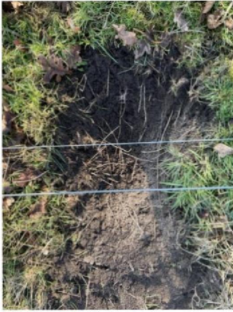
Onder raster door gegraven 1e plek