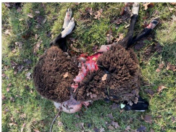
Dood schaap 4