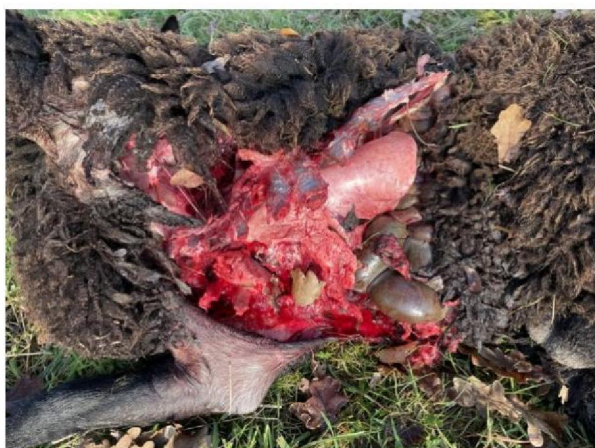
Vraatbeeld dood schaap 4