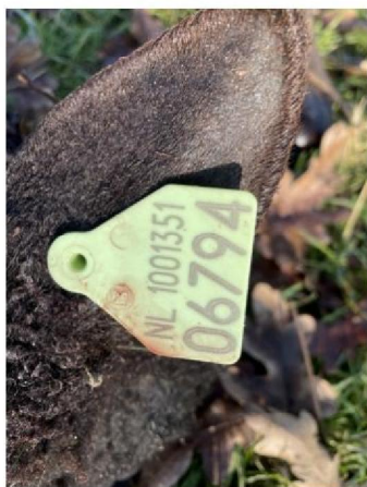
Oormerknummer dood schaap 3