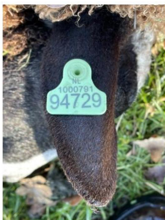
Oormerknummer dood schaap 2