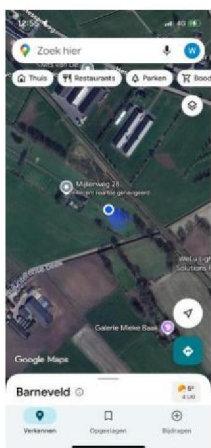
Locatie van aanval