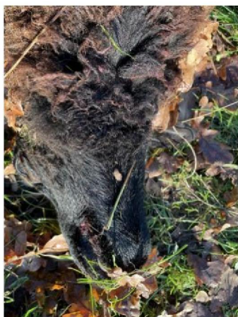
Keelbeet dood schaap 7