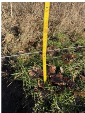
Hoogte raster bij onderdoorgraving 2e plek