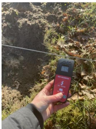
Spanning raster: 7.4 kV