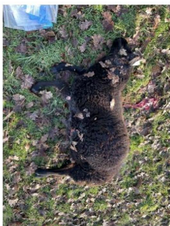
Dood schaap 3