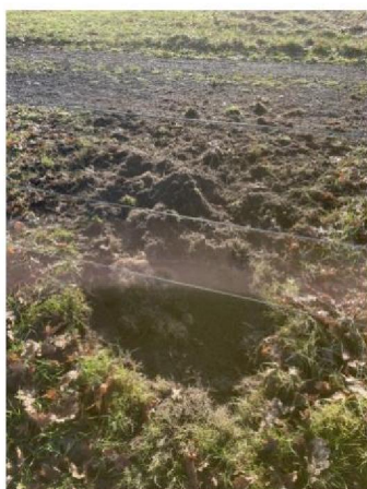
onder raster doorgegraven 3e plek