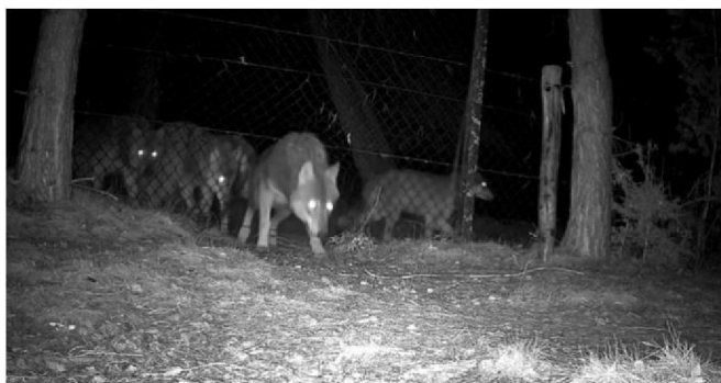
Screenshot van filmpje van wildcamera: roedel wolven in omgeving van aanval (Lunteren)