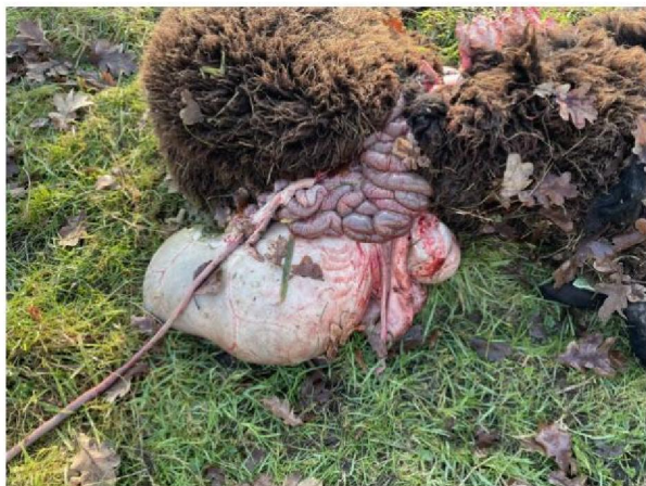
Vraatbeeld dood schaap 4