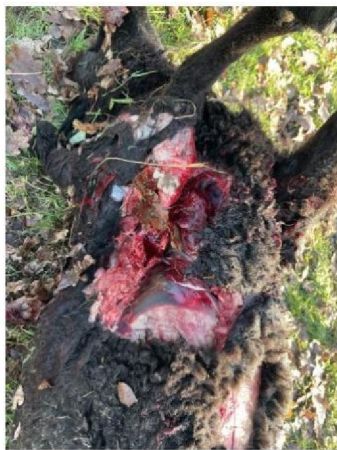
Vraatbeeld dood schaap 3