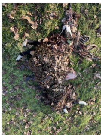
Dood schaap 5