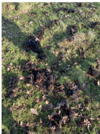
Uitgetrokken plukken wol