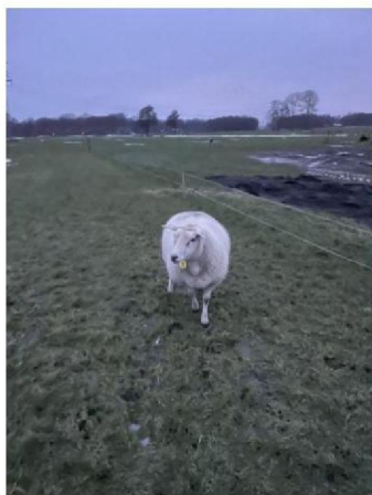
Overgebleven schaap uit kudde