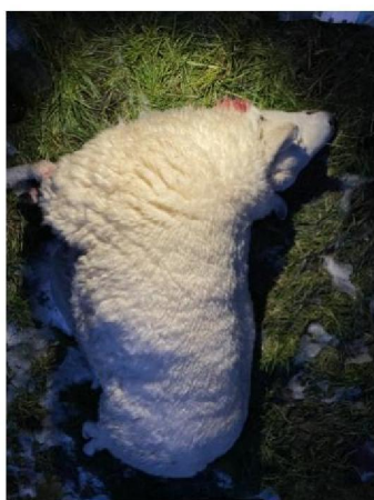
Dood schaap 2