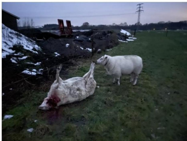
Overgebleven schaap in weiland