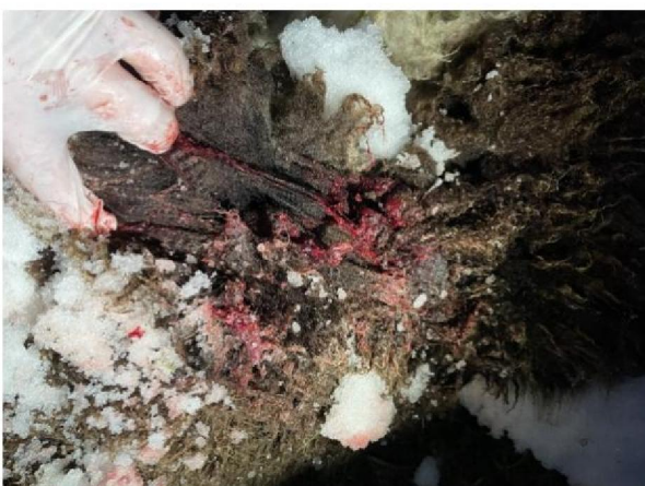
Bijtwond bij schouder dood schaap 4