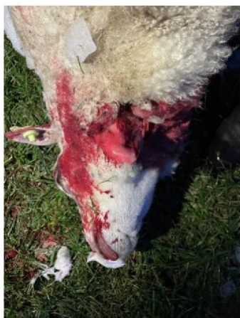
Keelbeet dood schaap 3