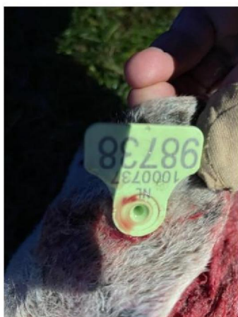
Oormerknummer dood schaap 3 (ram)