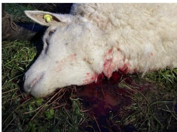
Keelbeet dood schaap 1