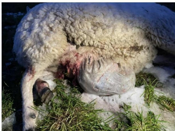
Vraatbeeld dood schaap 2