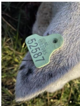
Oormerknummer dood schaap 1