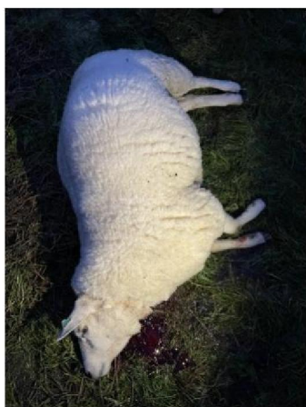
Dood schaap 1