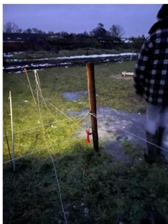
Draden kapot aan raster