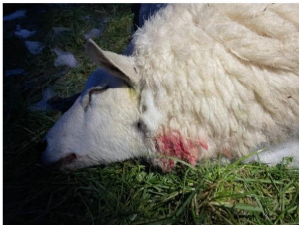
Keelbeet dood schaap 2