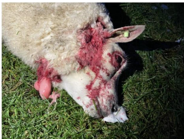
Keelbeet dood schaap 3