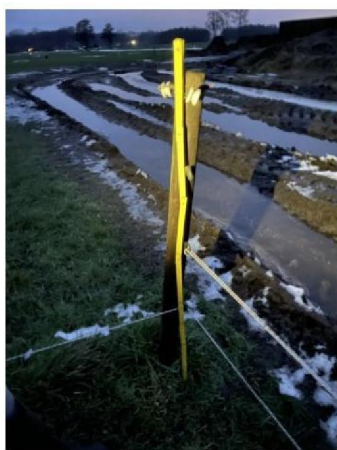
Hoekpaal met bevestiging voor 4 draden. 2 draden zijn afgebroken