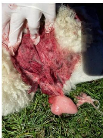
Keelbeet dood schaap 3