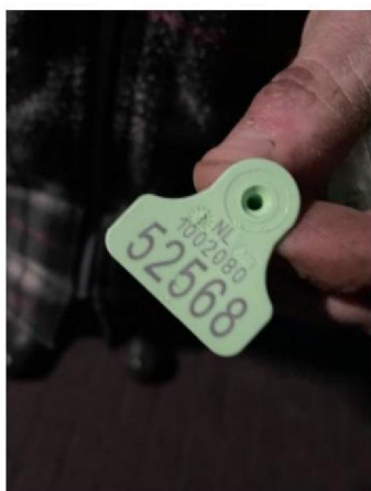
Oormerknummer dood schaap 2