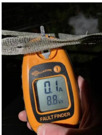
Spanning raster: 8,8 kV