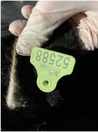
Oormerknummer dood schaap 4