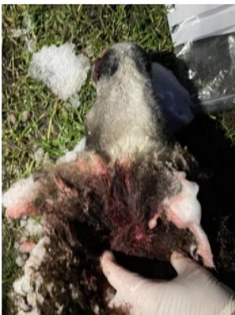
Keelbeet dood schaap 4