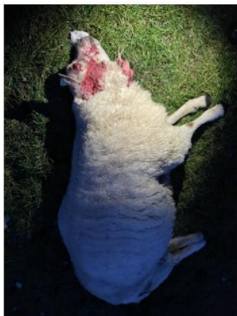
Dood schaap 3