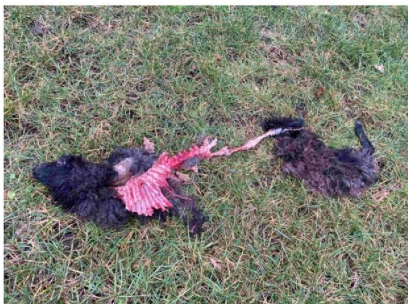
Overzicht restanten schaap