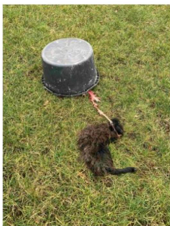
Restanten schaap teruggevonden in weiland van buren