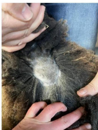
Wol uitgetrokken in keelgebied