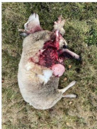
vraatbeeld dood schaap 3