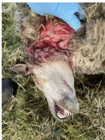
Keelbeet dood schaap 2