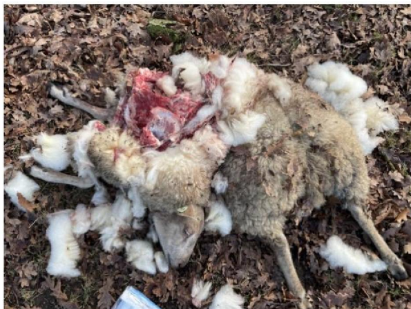
Vraatbeeld dood schaap 1