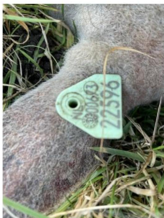
Oormerknummer dood schaap 3