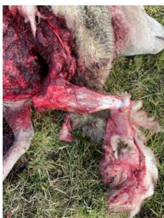
Vraatbeeld dood schaap 3