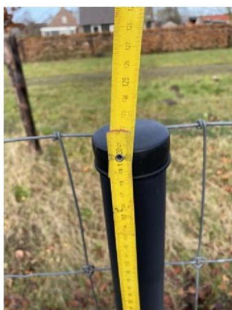
Hoogte raster: 120 cm