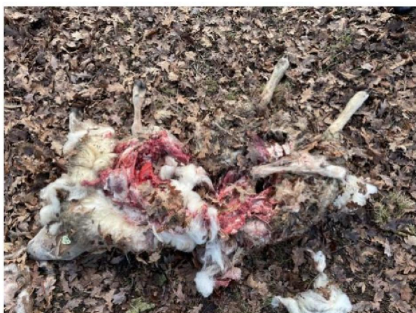
Vraatbeeld dood schaap 1