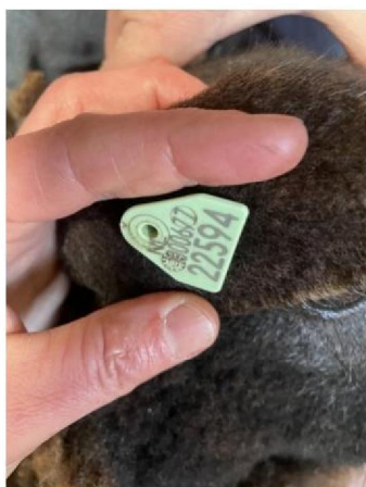
Oormerknummer gewond schaap 1 (ooi)