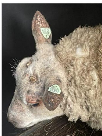
Oormerknummer gewond schaap 2 (ram)