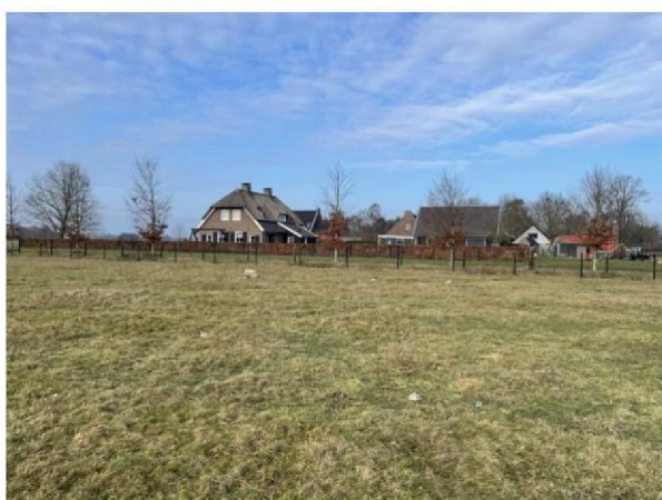
Weiland vlakbij woonhuis