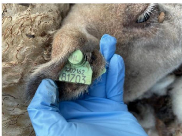
Oormerknummer dood schaap 1