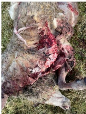
Vraatbeeld dood schaap 2