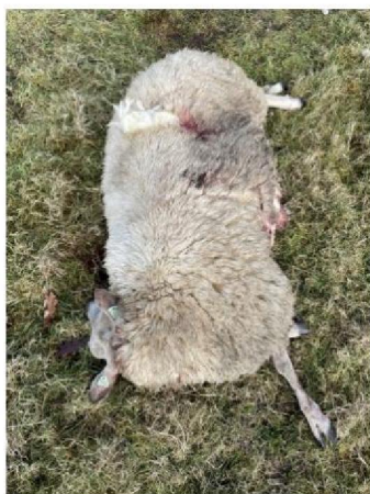
Dood schaap 2