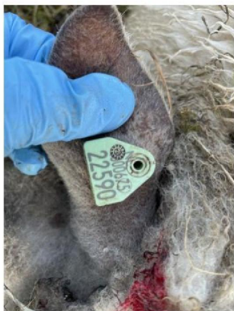
Oormerknummer dood schaap 2