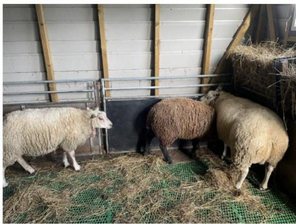
3 overgebleven schapen