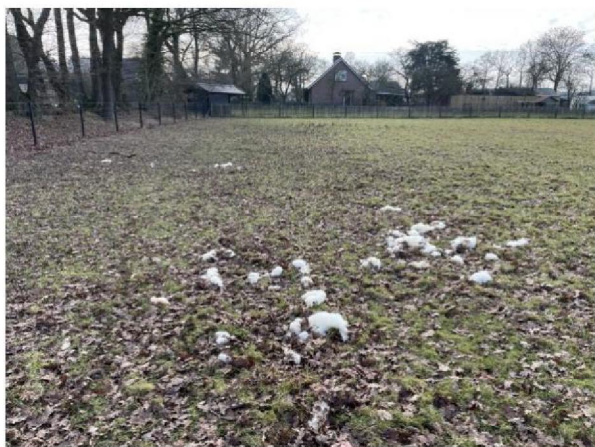
Uitgetrokken plukken wol