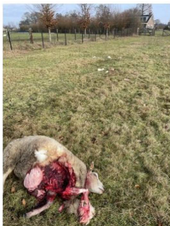
Dood schaap 3 + uitgetrokken stukken wol.