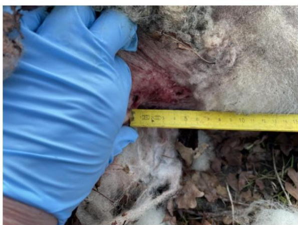
Afstand hoektanden: 5 cm