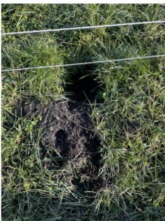
Graafsporen aan binnen zijde: niet aantoonbaar door wolf