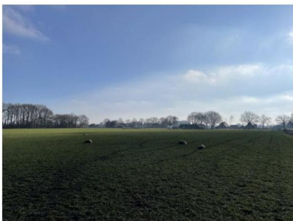
Weiland met dode schapen