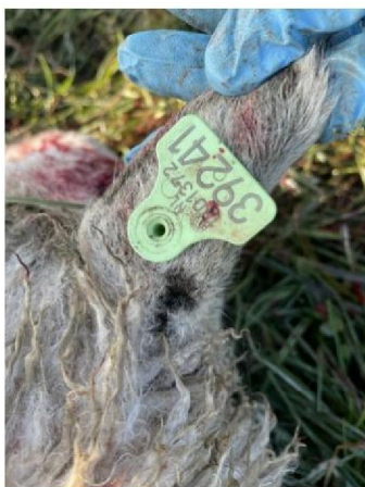
Oormerknummer dood schaap 1