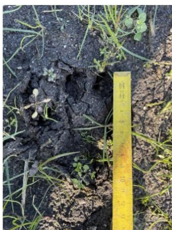
Pootafdruk in land linkerzijde naast raster