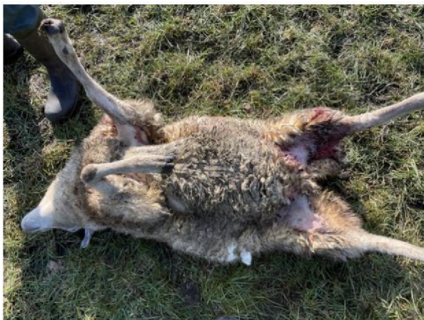
Verspreide bijtonden geëuthanaseerd schaap 2