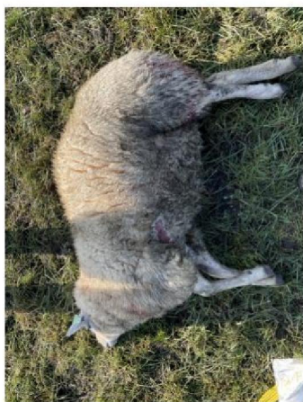
Geëuthanaseerd schaap 2