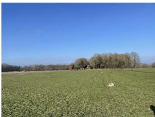
Weiland met dode schapen