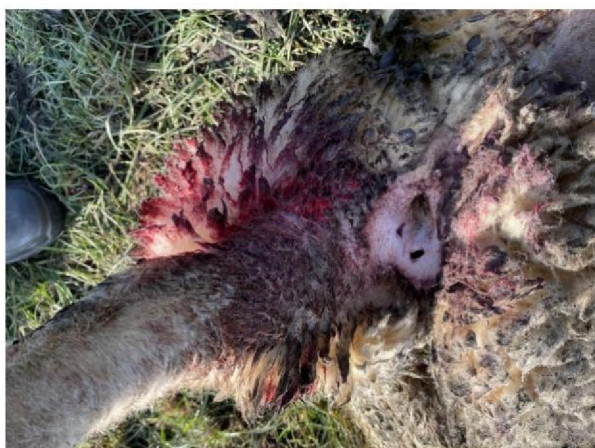
Bijtwonden geëuthanaseerd schaap 2