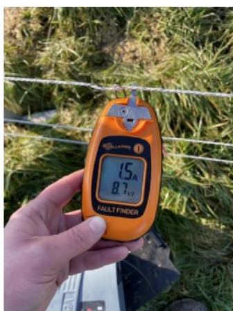
Spanning raster: 8.7 kV + lekkage