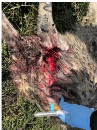
Vraatbeeld geëuthanaseerd schaap 1