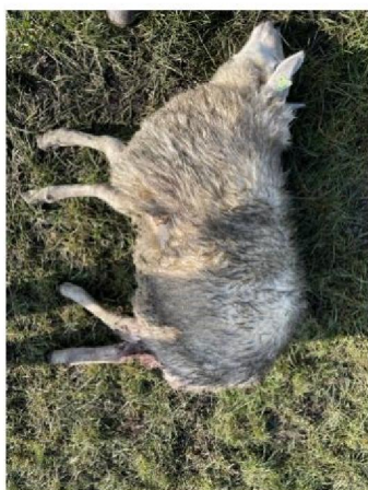
Geëuthanaseerd schaap 1