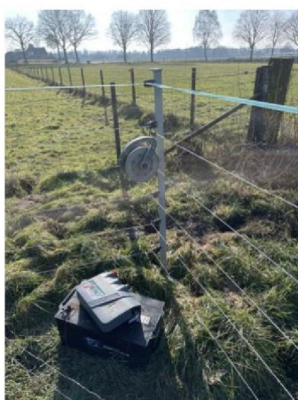
Raster + schrikdraadapparaat met accu