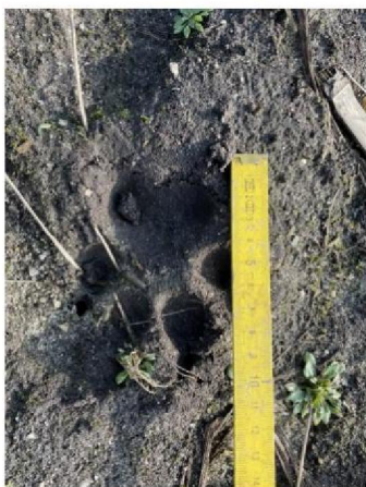
Pootafdruk in maisland aan rechterzijde naast raster