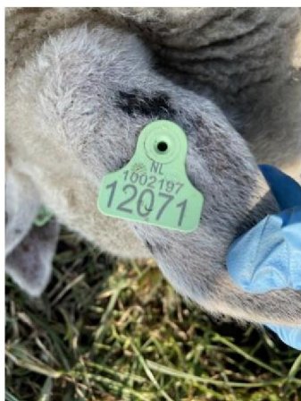
Oormerknummer geëuthanaseerd schaap 2