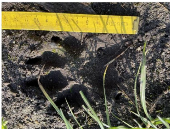
Pootafdruk in maisland aan rechterzijde naast raster