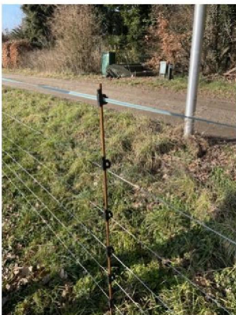
Oorzaak: verlies spanning --> draad zit niet goed in isolator