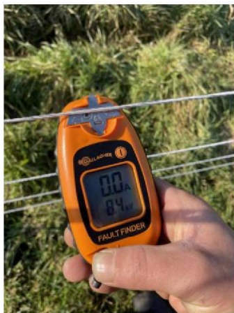
Spanning raster: 8.4 kV