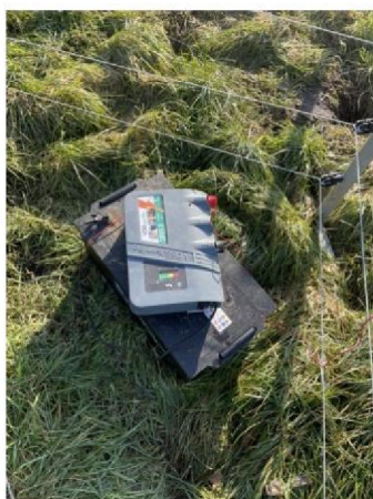
schrikdraadapparaat met accu