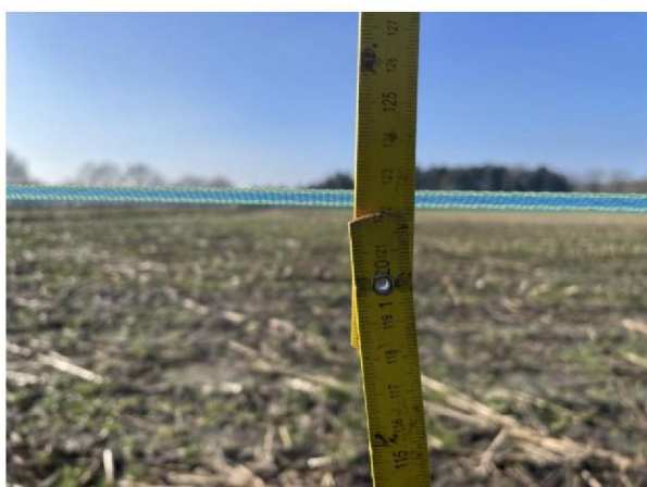
Hoogte raster: 122 cm