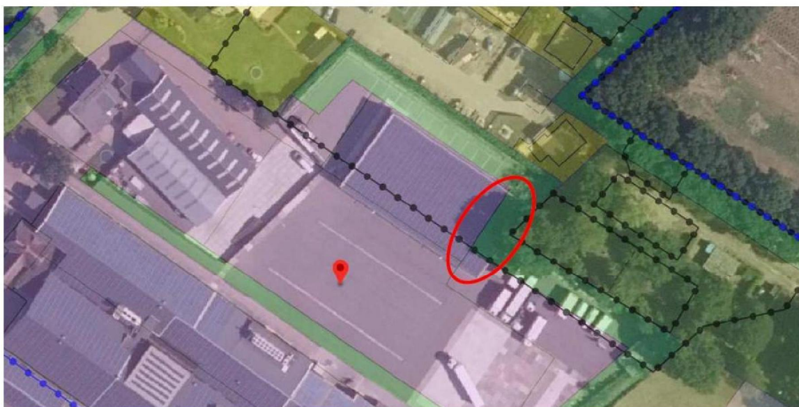
Figuur 1: uitsnede bestemmingsplankaart met daaronder de luchtfoto. De overschrijding van het bouwvlak is met rood omcirkeld.

Op 18 maart 2019, kenmerk e190013293, is een omgevingsvergunning verleend aan Tomassen Duck-To B.V. voor de bouw van een opslaghal op het adres Fokko Kortlanglaan 122 te Ermelo. De opslaghal is gedeeltelijk (128m 2 ) buiten het bouwvlak en in de bestemming "Groen" met functieaanduiding "houtsingel" gebouwd.