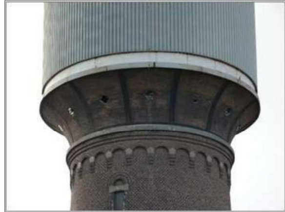
Afbeelding 2 | De kop van de watertoren.