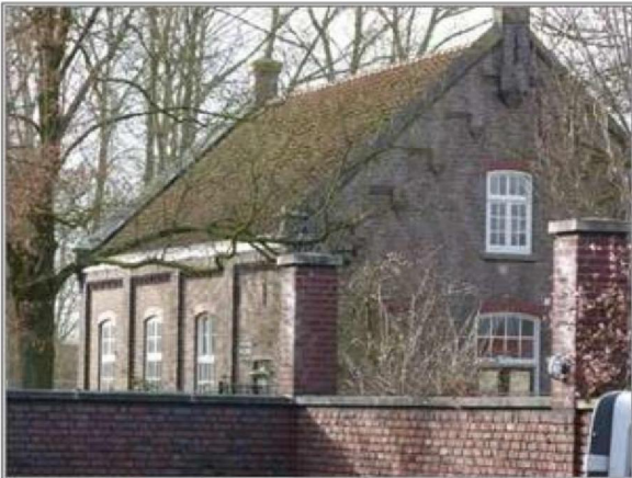
Afbeelding 3 | Het pomphuisje.