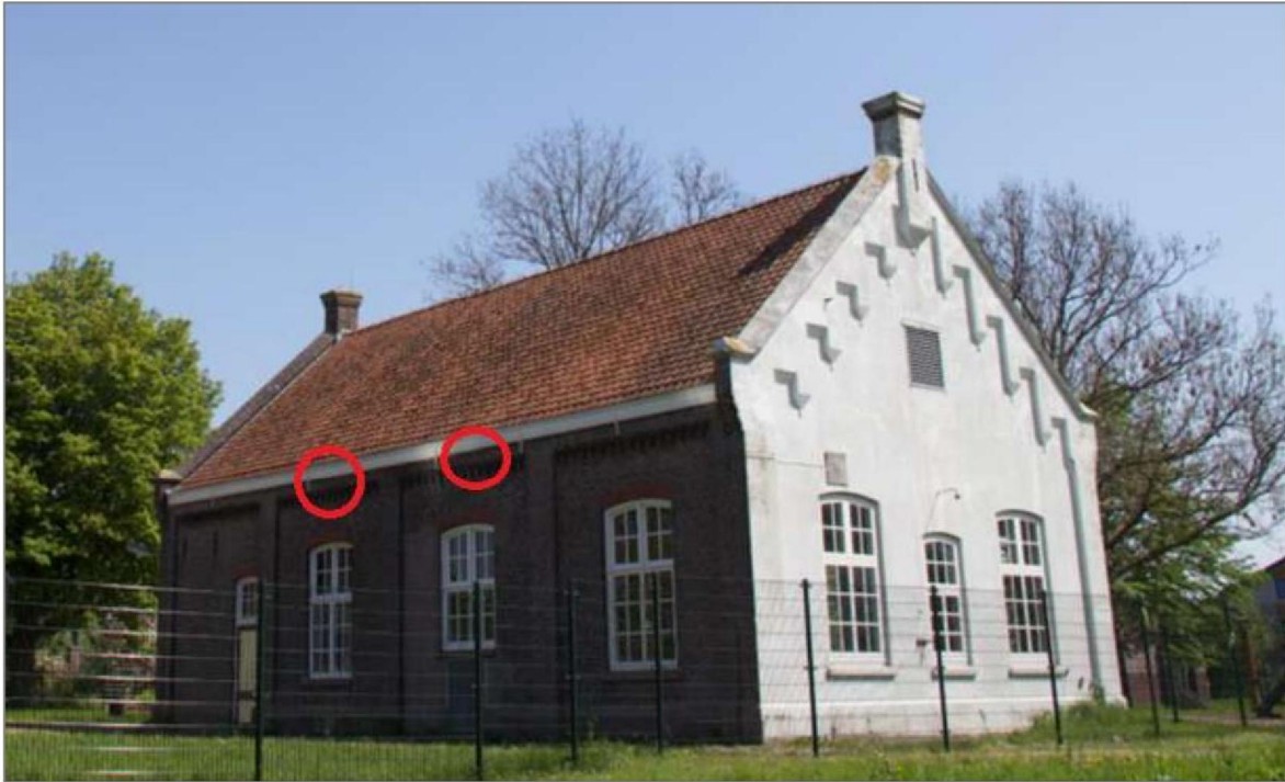
Afbeelding 1 | Locaties van de aangetroffen zomerverblijfplaatsen gewone dwergvleermuis.