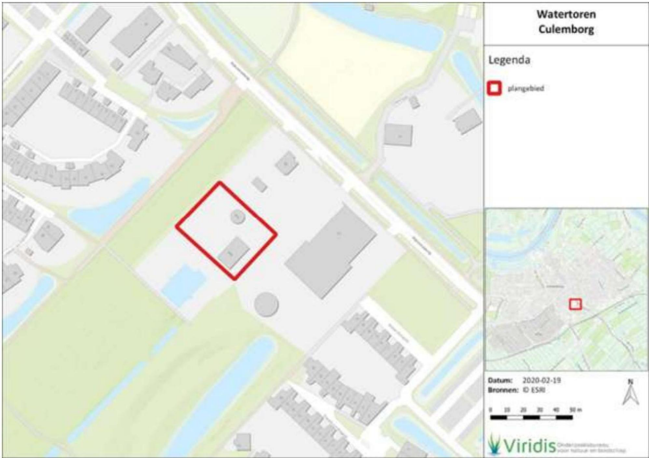
Figuur 1.1 | Overzichtskaart plangebied Watertoren te Culemborg.