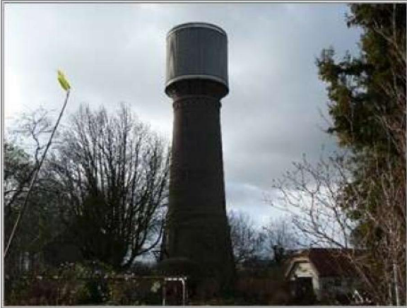
Afbeelding 1 | De watertoren.