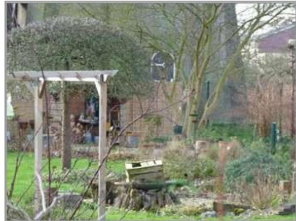
Afbeelding 4 | De tuin ten noordoosten van de watertoren.