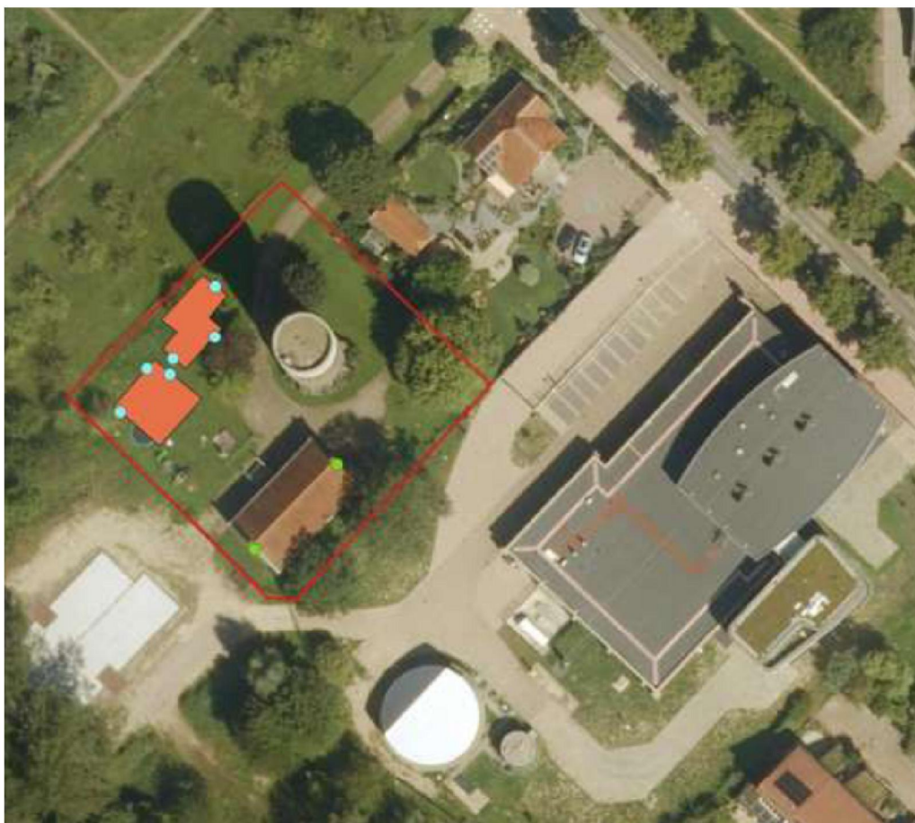
Figuur 4 Overzicht van de permanente verblijfplaatsen, 6 permanente verblijfplaatsen worden gerealiseerd in de nieuwbouwwoningen (aangeduid met de blauwe stippen) en 2 permanente verblijfplaatsen worden gerealiseerd binnen de renovatie van het pomphuisje (aangeduid met de groene stippen).