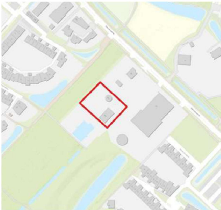
Figuur 1 Overzicht van het plangebied waar de voorgenomen werkzaamheden plaats gaan vinden, Rijksstraatweg 45 te Culemborg.