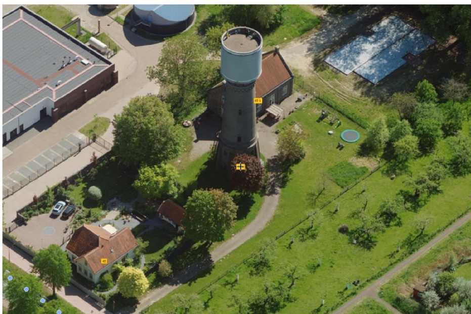
Figuur 2 Weergave vanuit StreetSmart van het plangebied waar de werkzaamheden plaats gaan vinden. duidelijk zichtbaar is de watertoren met daarachter het pomphuis.